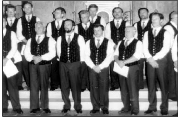
A Grafensteini dalosok egy csoportja