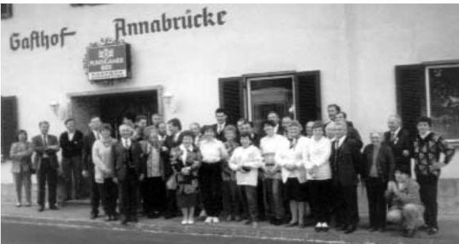
A búcsú percei vendéglátóink körében