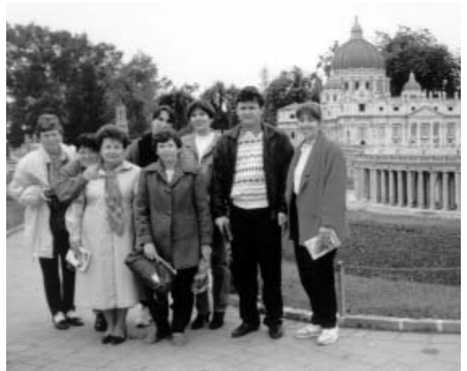
A Klagenfurti Minimundus megtekintése is felejthetetlen élmény marad