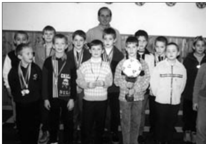
Az Év Csapata 2000-ben: a kis „Góliátok”