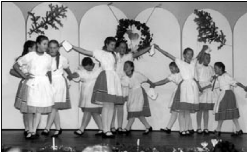
Már hagyomány a városban, hogy néptáncal kezdődik a karácsony. Decemberben a Hétszínvirág

Táncegyüttes majd a Jásztánc Alapítvány csoportjai mutattak be egész estét betöltő színvonalas előadást.