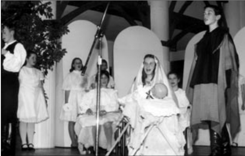
Karácsony előtt városunk önkormányzata ünnepi műsorral kedveskedett a nyugdíjasoknak. A Mívelődési Házban két délután rendezett előadáson felléptek a város iskolái és kulturális csoportjai, aminek nagy sikere volt az idősök körében