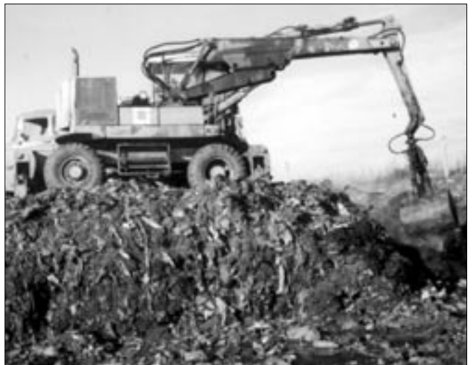
Mire az újság megjelenik, már befejeződik az ideiglenes hulladéklerakó tartalmának átrakása az új tároló belyre. Közel 12000m 3 tömör hulladékot mozgattak meg a Városüzemeltető Kft. gépei

A megbízás határozott időre szól, de szakszerű feladatellátás esetén évente pályázat nélkül meghosszabbítható. A pályázó az Önkormányzat felügyeleti és ellenőrzési jogát tudomásul veszi. Az ellenőrzések során tapasztalt hiányosság esetén a szerződés az Önkormányzat részéről egyoldalúan felbontható.