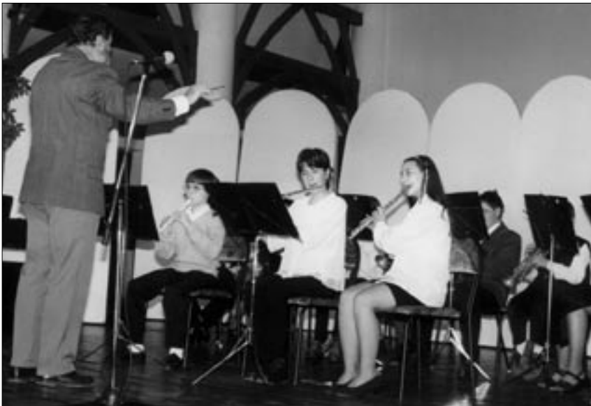
Szemünk előtt nő fel a város fívőszekara. A Rácz Aladár Zeneiskola növendékei önálló műsort adtak az év végi ünnepek előtti rendezvények sorában