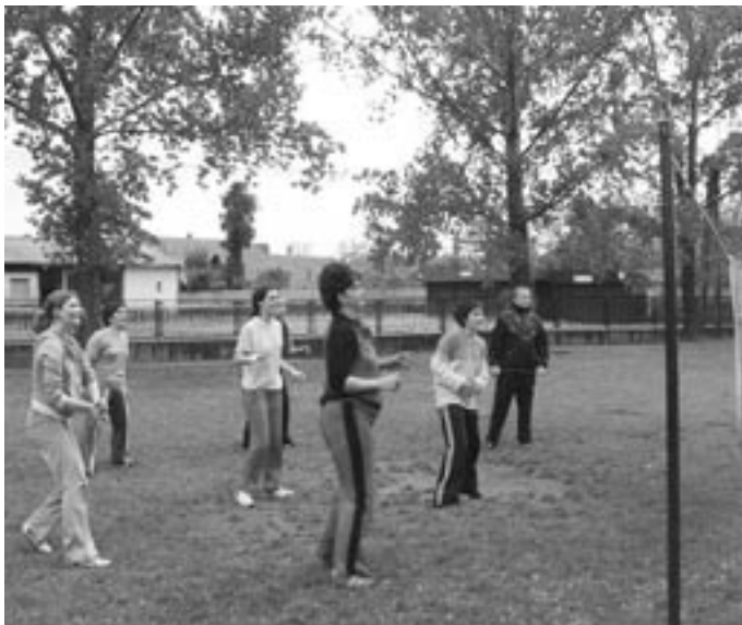
Sportnap az iskolában – a röplabdapálya egyik oldalán

Volt olyan osztály, amelyik kb. 90 km-t futott. A futáson kívül évfolyamszintű kispályás labdarúgó és röplabda bajnokságok voltak. Nagy sikere volt a tanár-diák kosárlabda és röplabda meccseknek. A program főzessel zárult, minden tanuló élményekkel gazdagodva térhetett haza.