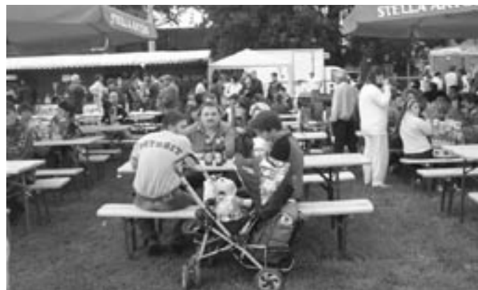
A július 11-én a hűvös idő ellenére sokan ültek a sörsátrak előtt