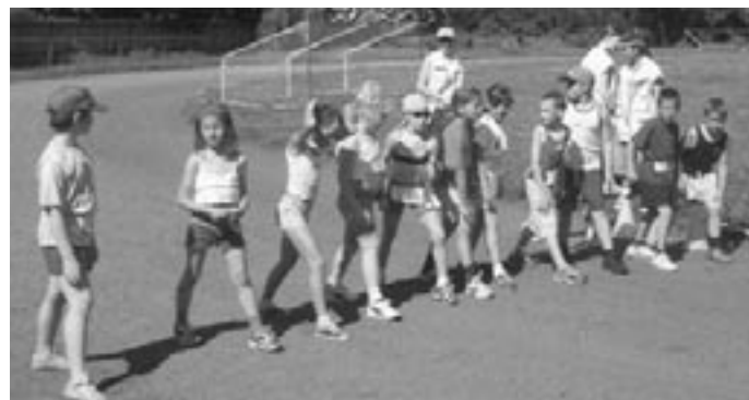
Nagyon sok jelentkező vett részt minden korosztályban a duatlon versenyen