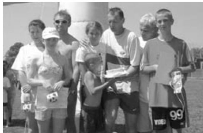
A családi váltóverseny nyertesei a dobogón