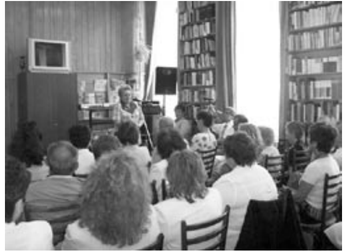
Az Ünnepi Könyvhét megyei megnyitója a könyvtárban

Június 2-án az Ünnepi Könyvhét megyei megnyitóját városunkban tartották. Talán azért esett a választás Jászapátira, mert az elmúlt évben önkormányzatunk elnyerte a „Könyvtár pártoló önkormányzat” címet azzal, hogy jelentős összeget biztosít a fejlesztésre.