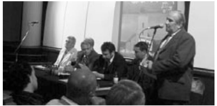
A megyei faluparlament vendégei

- Egy másik felszólaló szerint az EU-csatlakozás óta az olcsó külföldi termék elárasztotta az országot. Az emberek nem tudják mit jelent, ha a boltok polcai-