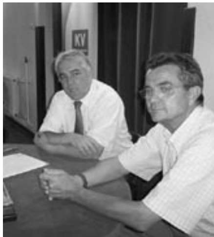
Kávé a miniszterrel

ahol nem működik munkahelyi szakszervezet.