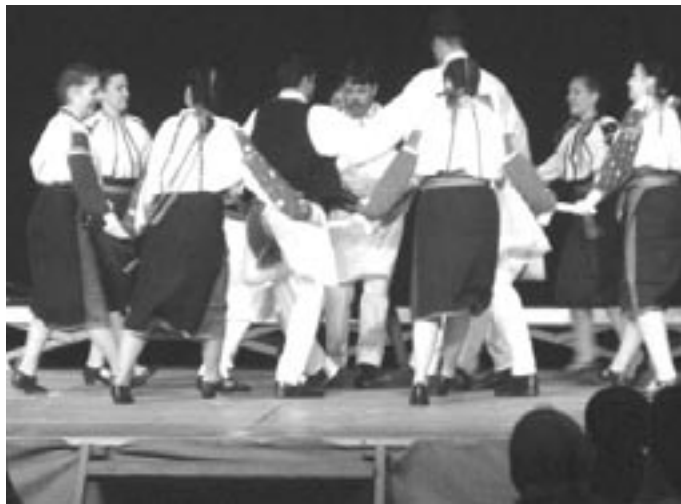
A Hétszínvirág táncgyűttes a francia színpadon

Csütörtökön délelőtt és délután is volt fellépésünk a sportcsarnokban. A környék iskoláinak diákjai tekintették meg műsorunkat. Este a szállásunkon – mivel már az indulás óta