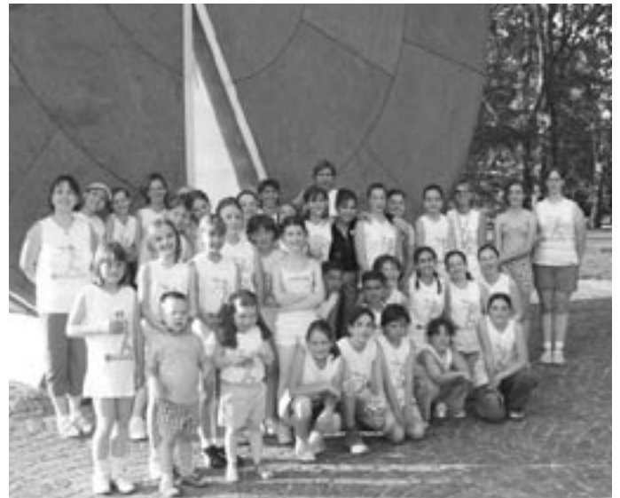
A futófesztivál résztvevői

Május 22-én rendezte a Budapest Sportiroda a 17. LIBRESSE női futó és mozgásfesztivált. A Vágó Pál általános iskola lányai tavaly is részt vettek, s a nagy sikerre való tekintettel az idén is összejött egy autóbuzsnyi lelkes, sportolni vágyó lány. Sőt, nem csak lányok, anyukák és tanár nénik is voltak, kedvet kaptak a mozgáshoz. Több, mint hét ezer induló állt a rajtkozhoz.