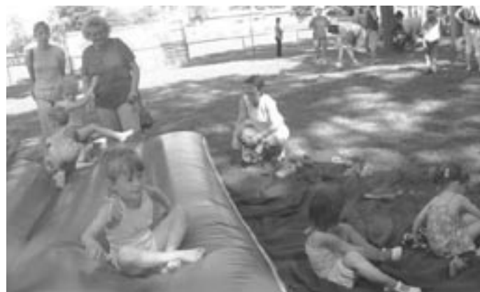
Képek a Városi Gyermeknapról. Ez a nap, kicsiknek és nagyoknak, a játékról szólt. Megismerhették a rendőrautót, a tűzoltó autót, kipróbálhatták a szirénát, sőt még igazi ujjlenyomatot is vettek tőlük a rendőr bácsik