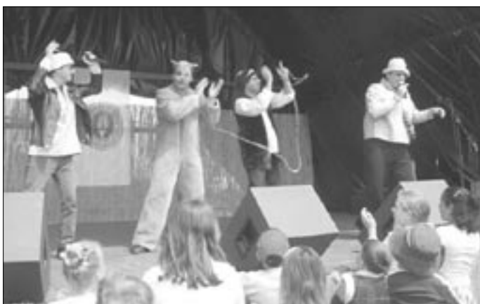
A fiatalok és idősebben kedvence az Irigy Hónaljmirigy volt