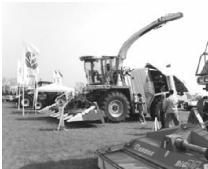
Mindkét napon nagy sikere volt a hatalmas, modern gépeknek a gyerekek körében