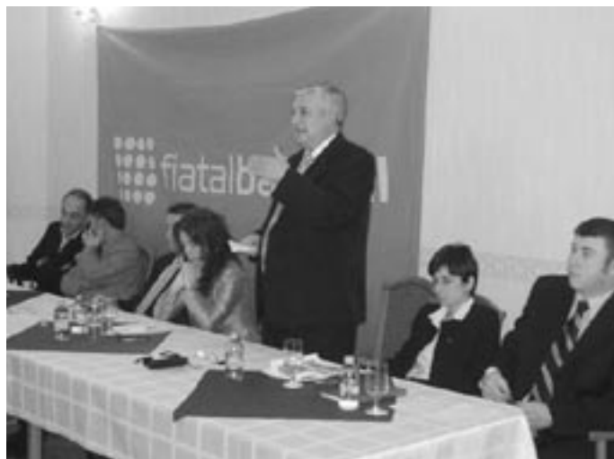
Az ünnepi ülés elnöksége

mákban hallhattak előadásokat a meghívott előadóktól. Tokár István, a Jász-Nagykun-Szolnok Megyei Önkormányzat elnöke, a megyei önkormányzat működéséről, feladatairól beszélt. Zachar Ferenc, a Jász-Nagykun-Szolnok megyei 2. számú választókerületi MSZP elnöke, a választókerületi társulások mű-