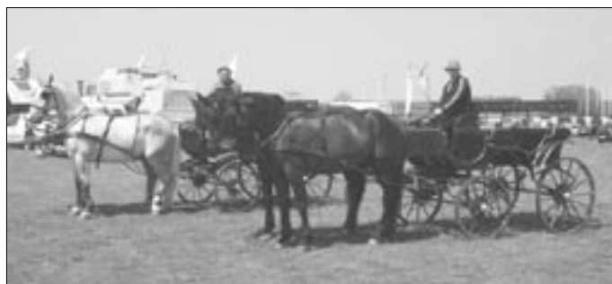
Az idén először, amatőr kettesfogatok is versenyeztek.