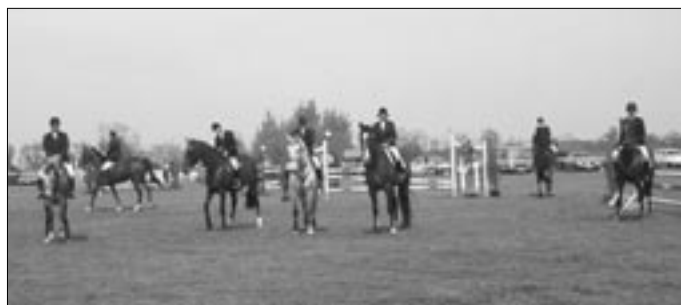
A tavasz első díjugrató lovasversenye mindig a Gazdanapokon van