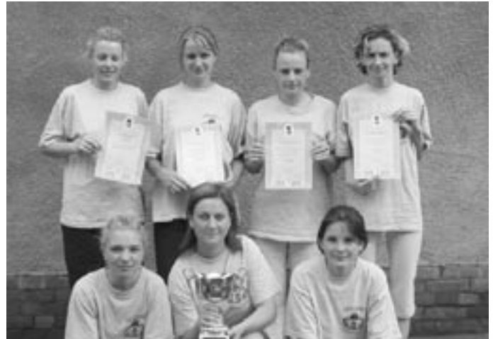
Női csapatunk jászági csúcst díjnyert

A hagyományos Jászági tűzoltóverseny megrendezésére az idén Jászberényben került sor 2005. május 14-én, melyen a Jászapáti Önkéntes Tűzoltó Egyesület négy csapattal vett részt három kategóriában két férfi, egy női és egy ifjúsági csapattal.