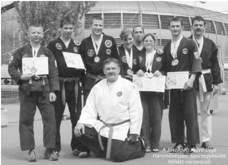
A Jászapáti Kígyó Dojo Harcművészeti Sportegyesület felnőtt versenyzői

A Budapest Körcsarnokban került megrendezésre a Magyar Zen Bu Kan Kempo Sportszervezet talán legrangosabb versenye, a „Felnőtt Országos Bajnokság”. Itt a Sportszervezet 18 klubjának közel 200 versenyzője állt rajthoz és mérte össze tudását formagyakorlat, fegyveres formagyakorlat, szinkron formagyakorlat, önvédelem, há-