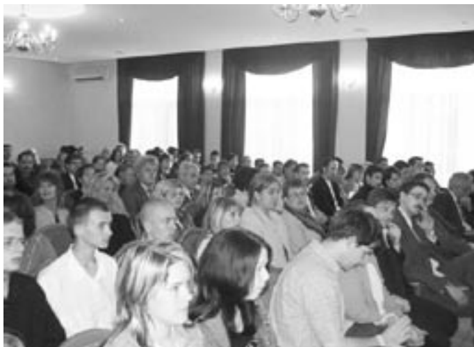
Jászapátin tartotta ünnepi ülését a FIB megyei szervezete

a FIB városi elnöke, önkormányzati képviselő