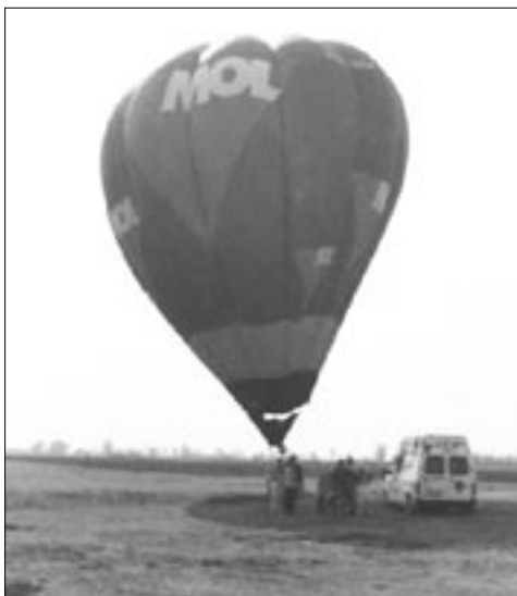
A Tavaszindító Gazdanapok és a Városi Majális az idén közös rendezvényen fogadta a látogatókat