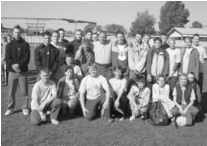
A Jászapáti Önkéntes Tűzoltó Egyesület csapata