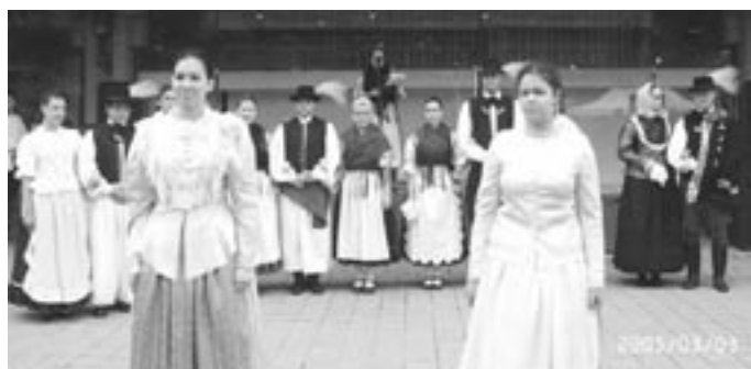
A Rokolya Varróműhely munkái a szolnoki kiállításon.

Május 19 – én délelőtt az esős idő ellenére több mint 250 kisgyermek előtt adott színvonalas koncertet a Kolompós népzenei együttes, akik főleg gyermekműsoraik kapcsán ismertek.