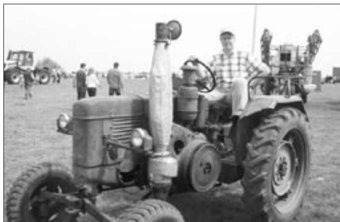
Régi emlékeket idéző veterán traktorok is megjelentek az idei kiállításon