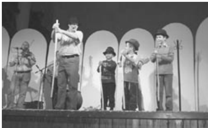
A Jásztánc Alapítvány műsora

mekek nagy tetszésére. A műsor tartalma a Furulyás Palkó népmese feldolgozása volt, amelyben ismert népi gyermekdalokat is hallhattak, és közösen énekelhettek a résztvevők.