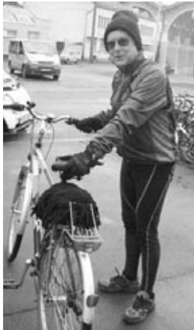
Négy hónap alatt bejárja az országot a Mosolygó Kórház Alapítványának elnöke

A Mosolygó Kórház Alapítványának elnöke városunkban