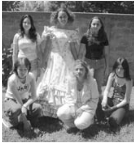
a Déryné-ruha és készítői

Másnap a résztvevők ellátogattak Magyarpolányba, az 1300 lakosú sváb településre. A majd száz védett épületével a Nemzet Örök-