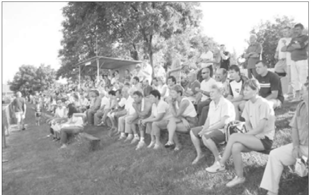
Rekord számú szurkoló biztatta a csapatot az első megmérettetésen