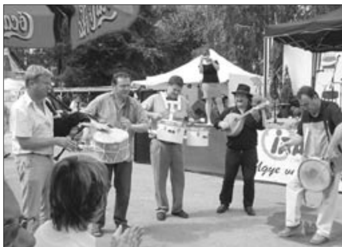
A zenészek a közönség közé lopkodtak hangszereikkel, hangulatot csinálni