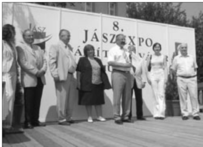
A francia delegáció vezetőjét köszöntik az Expo rendezői

Sikerrel mutatkozott be francia testvérvárosunk és környéke Jászberényben a Jász Expo-n. Három standon ismerhették meg a jász emberek a Carignan régió nevezetességeit, kóstolhatták meg a finom húskészítményeket és a házi főzésű francia sört. Vendégeink nem számítottak a sör sikerére, keveset hoztak, mert már a vásár első napján elfogyott, még a poharak és alátétek is elkelték. Láthattak az érdeklődők eredeti Maronet bábokat, vásárolhattak termézetes anyagból, egyedi készítésű bizsukat is. A szabadtéri színpadon pedig megszólaltatták a legkülönlegesebb hangszereket, és a hagyományos népzene, nagy taps kíséretében. Abban a reményben utaztak haza, hogy további kulturális és esetleg gazdasági kapcsolat is követheti ezt a találkozót.