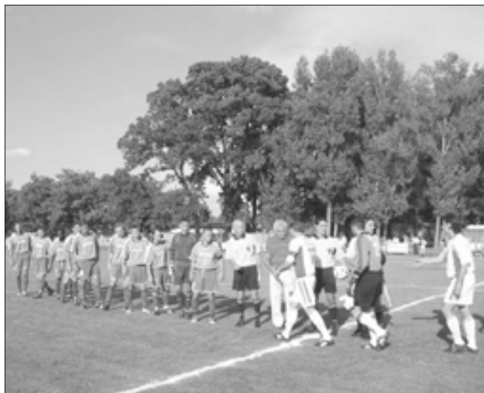
A csapat az első hazai mérkőzést játszotta a labdarúgás második vonalában, városunk színeiben