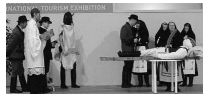
Farsangi maszkázás a budapesti Utazás kiállításon. A Hétszínvirág táncgyűttes és a helyi hagyományörzők télbúcsúztató vidám maszkázása nagy sikert aratott korábban a JABE bálon is. Írásunkat az 5. oldalon olvashatják.

6. oldal: Kedves Szülők! Leendő Elsősök! Beiratkozás 7. oldal: Rendezvények, anyakönyvi hírek 9. oldal: Szabadidős tevékenységek az István Király Iskolában 10. oldal: Rejtvény 11. oldal: Téli kirándulás Galyatetőre Sakkhírek