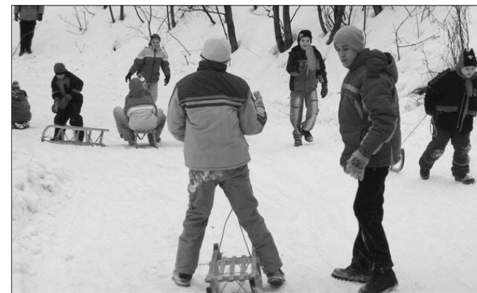
Nemcsak a gyerekek, a szülők is élvezték a szánkózást a hegyekben.

A Vágó Pál Általános Iskolában hagyomány, hogy ősszel és tavasszal utcai futóversenyeken való részvételre szervezünk futni, mozogni vágyó kisdíjakokat.