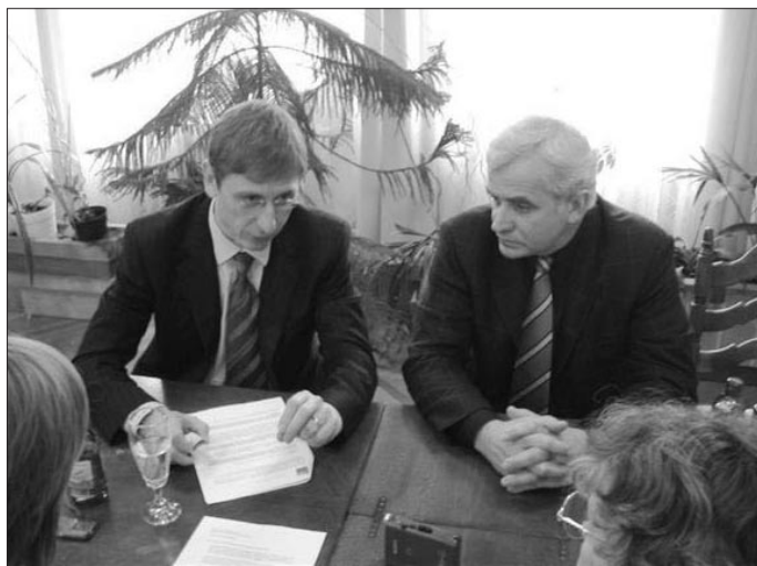
A miniszterelnök a polgármester társaságában válaszol kérdéseinkre

Az új Magyarország programja három nagy célt jelöl meg, amely Magyarország számára a felemelkedés, a megerősödés útja. A háromból az egyik az idegenforgalom, a turizmus, ezen belül kiemelt terület a gyógyidegenforgalom, az egészségipar, gyógyturizmus. A következő év elejétől, amikor az Európai Unió pénzek a mainak háromszoros mértékben állnak majd rendelkezésre, ez az egyik fő irány. Nem is az lesz majd a kérdés, hogy van-e ilyen pénz, mert pénz lesz, hanem az, hogy vannak-e jó tervek, lehetőségek, amik nemcsak egyszerűen költenek a pénzt, hanem ahogy Ön is mondta, munkahelyet teremtenek. Ha épül egy ilyen beruházás, mellé már magántőkéből lehet építeni kempinget, szállodát, éttermet. Ez munkát jelent nagyon-nagyon sokaknak. Gyereink jászapátiakat, tenni a dolgukat! Teszik is, nem kell őket féltetni, menni fog ez!