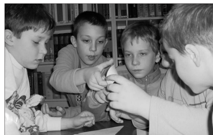
Farsangi vetélkedő - Fiúk 3.a

Iskolánk tanulóinak körében nagy népszerűségnek örvend a sí. Minden első tagozatos tanulóknak lehetősége nyílt arra, hogy kipróbálja az iskolaudvaron, és