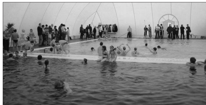
A márciusban rendezett úszóversenyen a város és a környék általános iskolás diákjai mérték össze erejüket. Az eredményekről a Jászapáti Hírmondóban tájékozódhatnak.

Szeretnék köszönetet mondani az anyukáknak, apukáknak, kollégáknak, akik nagyon sokat segítettek e vidám hangulatú kirándulás létrejöttében.