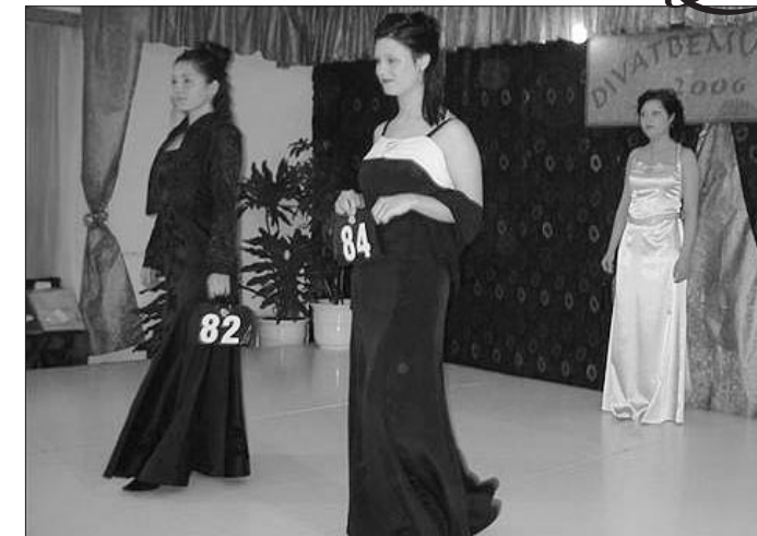
A diákok saját maguk számára készített ruhákkal versenyeztek

déglátóipari Szakképző Iskola és Kollégium, Jászapáti.