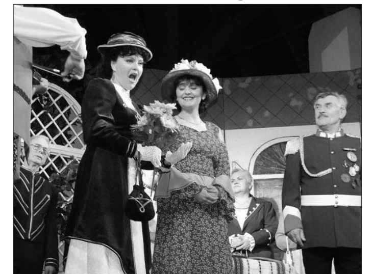
A Színjátszó Kör teltház előtt mutatta be új darabját, a Marica Grófnőt. A nagy sikerre és érdeklődésre való tekintettel, újra előadják április 29-én 16 órakor.

♦ A JÁSZ ÚJSÁG támogatói: Jászapáti Város Önkormányzata ♦ Az újságban megjelenő hirdetések ♦