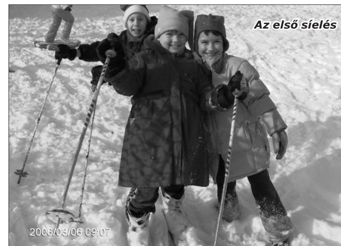
Az első síelés

Az István Király Általános Iskola Tehetségért Alapítványa az idén újra bált rendezett, amely