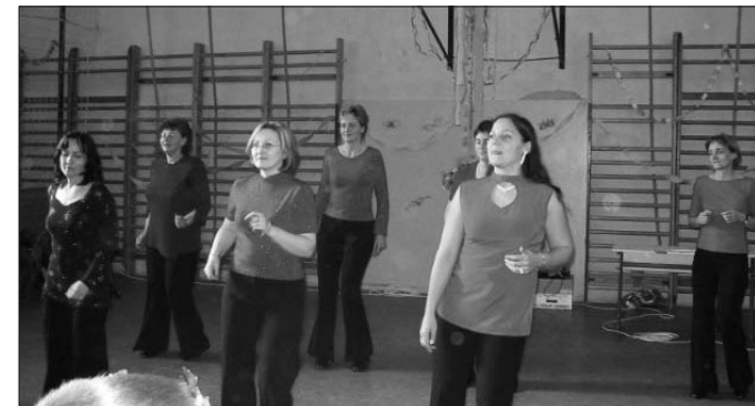
A tanító néni tánckarának bemutatója a farsangi bálon