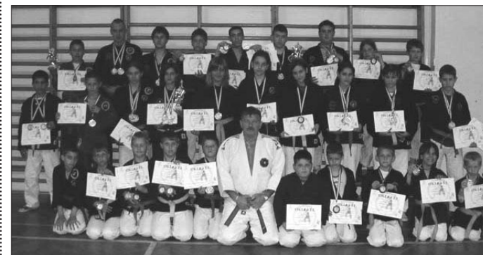
A Jászapáti Kigyó Dojo Harcművészeti Egyesület 31 versenyzőt indított különböző kategóriákban a küzdelmekben.

2006. május 7-én a budapesti Honvéd Küzdősport Centrumban került megrendezésre a „2006. évi Sport jitsu Gyermekek és Junior Magyar Bajnokság”. A bajnokság szervezését a Magyar Sport Jitsu Szövetség a rendezését a budapesti Magyar Harcos Sportegyesület biztosította. A rangos vetélkedőn 7 stílusirányzat 15 Sportegyesület és Sportklubjának 150 versenyzője mérte össze tudását, 14 éves korostól önvédelmi, gyo önvédelmi bemutató és földharc, 18 éves korostól önvédelmi, gyo, földharc és Sport jitsu „C” versenyszámokban, korosztály, minősítés és súlykategória szerinti megosztásban.