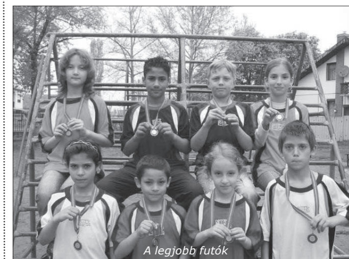
A legjobb futók