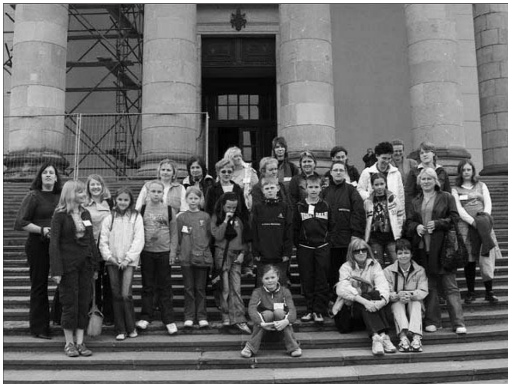
A külföldi vendégekkel Egerben is jártunk.