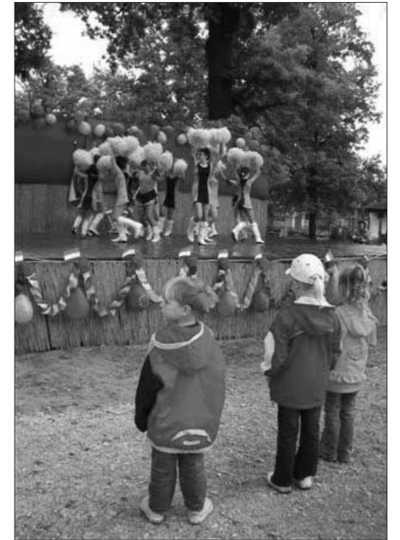
A hűvös, esős idő ellenére nagyon sokan kilátogattak idén is a sportpálya területére, a Rácz Aladár Zeneiskola fúvósainak hívogató hangjaira, majd a színpadon egymást követték az énekesek, táncosok – esernyővel vagy anélkül, az időjárásnak megfelelően. A kicsik minden fellépőt közelről is megnézték.