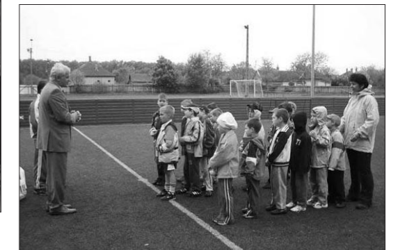
Az óvodások focicsapatai a műfüves pályán játszott, a végén mindenki kapott valamilyen ajándékot Szabó Lajos polgármestertől.

❖ A JÁSZ ÚJSÁG támogatói: Jászapáti Város Önkormányzata ❖ Az újságban megjelenő hirdetések ❖