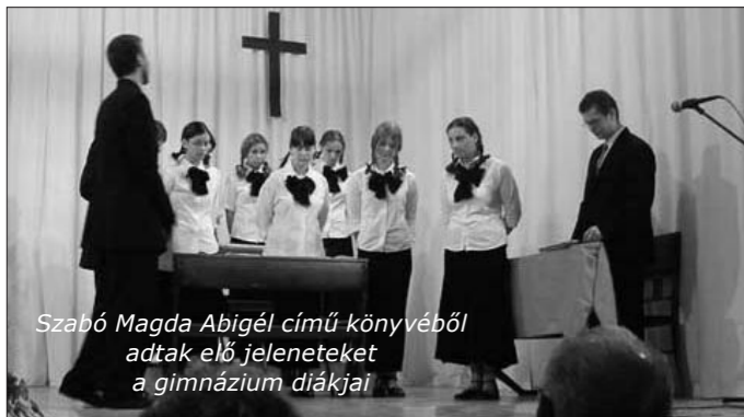
Szabó Magda Abigél című könyvéből adtak elő jeleneteket a gimnázium diákjai

65 éve született meg a gimnázium falai között az a bentlakásos intézmény, amely az államosításig internátus volt, majd diákolthoz, s végül kollégium lett az Országos Falusi Tehetségmentés által életre hívott intézmény.