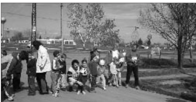
Az óvodások a rajt előtt, szülői biztatással