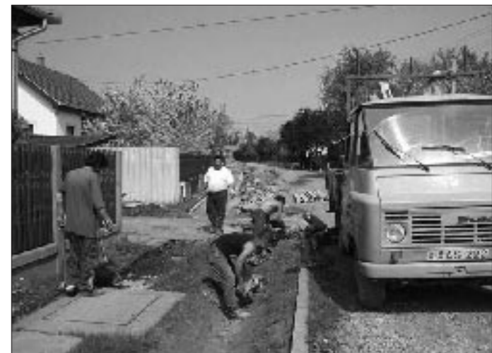
Az önkormányzat jelentős járda felújításba kezdett, melynek köszönhetően eddig már 500 fm készült el a város különböző pontjain. A fotón a Jókai utcában folyó előkészítő munkák láthatók. Az önkormányzat kéri a lakosságot, hogy az új járdát folyamatosan locsolják a beton teljes megszilárdulásáig.