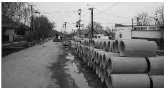
Jó ütemben halad a Damjanich út felújítása. Mikorra e sorokat olvassák, a képen látható csapadékelvezető betongyűrűk elhelyezésre kerülnek az újonnan épülő (egészen a Nyárfás útig futó) kerékpárút alatt és a térburkolt járda is túl lesz az Utassi utcai csatlakozáson. A felújítási munkák – elektromos hálózat átalakítása, kerékpárút megépítése, aszfaltburkolat, térburkolt járda – május végére befejeződnek. A munkavégzés azonban csak átmenetileg marad abba, mert ősszel az ÉMÁSZ megszünteti a nagyfeszültségű elektromos hálózatát.