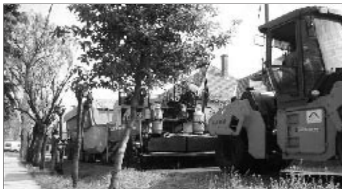
A tavasz beköszöntével az aszfaltozási munkák is kezdődtek városunkban. Több mint 10 utcában a szennyvízberuházást követő úthelyreállítást végezték el, illetve pályázaton nyert pénzből útfelújítások zajlanak. A beruházás ütemét követve egész évben folyamatosan megy az aszfaltozás.