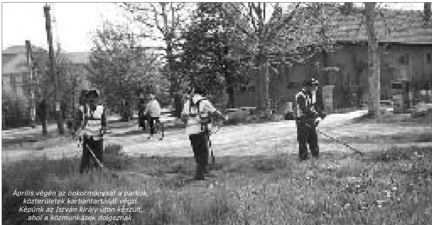
Április végén az önkormányzat a parkok, közterületek karbantartását végzi. Képünk az István király úton készült, ahol a közmunkások dolgoznak.