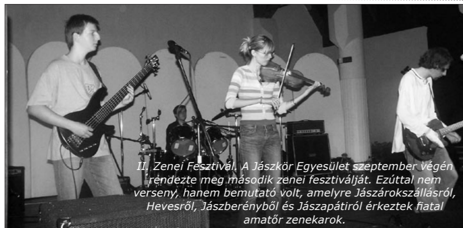
II. Zenei Fesztivál. A Jászkör Egyesület szeptember végén rendezte meg második zenei fesztiválját. Ezúttal nem verseny, hanem bemutató volt, amelyre Jászárokszállásról, Hevesről, Jászberényből és Jászapátiról érkeztek fiatal amatőr zenekarok.

A fent említettek közül is látható, hogy az alapítvány célja minél több gyermek tudását, értelmi és érzelmi fejlődését szolgáló tevékenységek támogatása. Meglévő lehetőségeinket más forrásokkal is kiegészítjük. A gyermekeket igyekszünk arra ösztönözni, hogy önmagukért és diákközösségükért ők maguk is próbáljanak hasznos dolgot tenni. Így az elmúlt év és a most ősszel megrendezett fémhulladék és papírhulladék gyűjtési akcióból, oktatásuk színvonalának emelésére, projektort és laptopot vásárolunk.