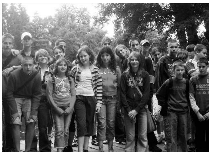
A Vágó Pál Iskola diákjai Nagyvisnyón

esni az eső, de mi nem tántorodtunk meg. Ám alig tettünk meg pár száz métert, megtámadtak a méhek. Ezek az apró rovarok bizony alaposan megbolygatták a mi kis túránkat, a fájdalmas csípésekről nem is beszélve.