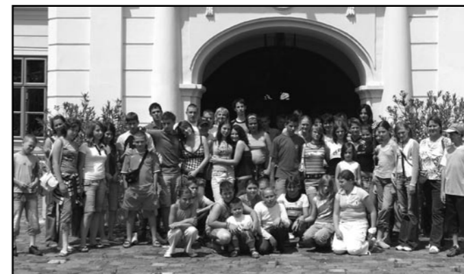
A Vágó Pál Iskola diákjai