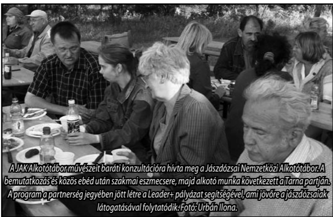
A Jász Alkotók Köre művészei baráti konzultációra hívták meg a Jászdszai Nemzetközi Alkotótábor. A bemutatkozás és közös ebéd után szakmai eszmecsere, majd alkotó munka következett a tábor partján. A program a partnerség jegyében jött létre a Leader+ pályázat segítségével, ami jövőre a jászdszai lakótelep látogatásával folytatódik.

Ebben az évben is nagy élményt jelentett számunkra a jászapáti Aratónap színes látványossága, amely a magyar népi múltunk egy elfelejtett hagyományát, elemét támasztja fel.