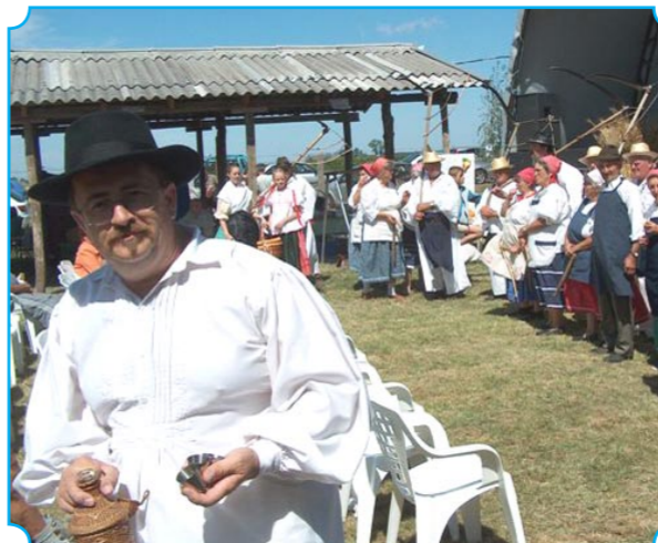
Az erős szél sem fújhatta el a rendezvényre érkező vendégeket. Az aratópálinkával kezdődött a nap, a szépen felújított tanyamúzeumnál.