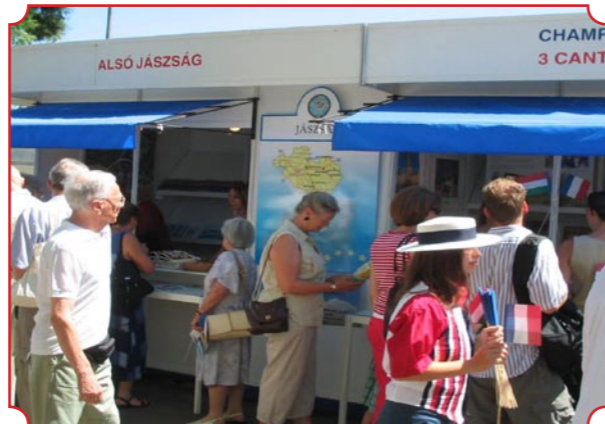
A Francia Gazdasági Év megnyitása alkalmából Budapesten a Bem rakparton rendezett kétnapos kirakodóvásáron az Alsó Jászságot a Tourinform Iroda munkatársai képviselték, közös pavilonban a Három Kanton nevű francia testvérvárosi régióval.