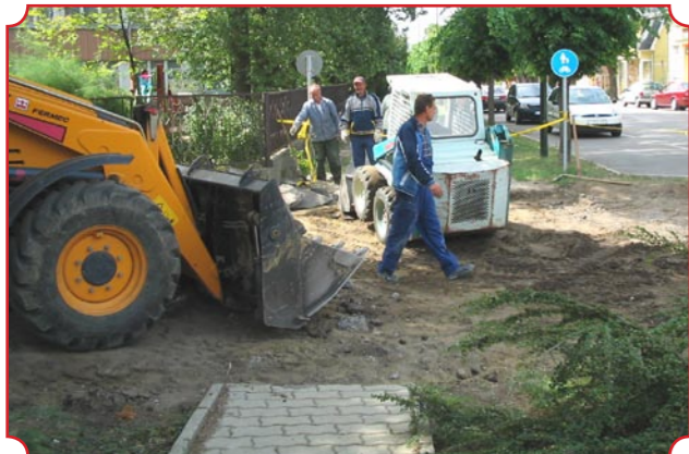
Javában zajlik a déli városrész felújítása az elnyert pályázat alapján.