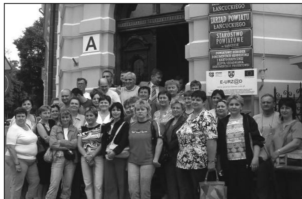
A lancuti városháza előtt a magyar delegáció tagjai

A hivatal megtekintése után el látogattunk a város sportcentrumába, ahol egy 1000 fő befogadására alkalmas sportsarnok, úszómedence, pezsgőfürdő, biliárdszalon, edzőterem és rendezvény terem várja a látogatókat. Másnap a Potoczky család kastélyát és a hozzá tartozó kocsiműzeumot jártuk be. Ebéd után az italmúzeumban mutatták be a vodka- és a likőrkészítési eljárást és a program végén lehetőségünk volt a tradicionális lengyel italok kóstolására. Az esti program a Markowai Skanzenben folytatódott, ahol jellegzetes, hagyományos lengyel épületeket láthattunk. A járási vezetőkkel és a markowai polgármesterrel elköltött vacsora után zenés-táncos mulatságot