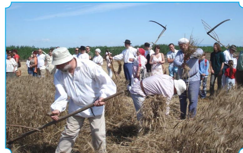
Lengyel testvérvárosunkat is képviselte egy ügyes kaszás, aki példás rendet vágott a jászapáti búzában.