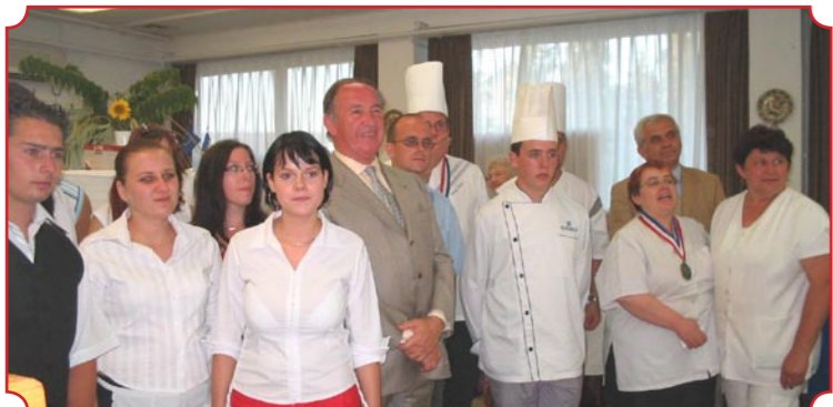
A francia régió vezetője és polgármesterünk, a közreműködő szakácsok társaságában Júliustól Francia Gazdasági Év kezdődött Magyarországon. A rendezvénysorozat ünnepélyes megnyitóját a francia testvérvárosi kapcsolatunk révén, gasztronómiai bemutatót rendezett a Budapesten működő Párizs Kertje (Le Jardin de Paris) étterem tulajdonosa, az ipari iskola tankonyhájának és diákjainak közreműködésével. Ezen a napon több mint száz jászági vendég kóstolhatta meg a francia konyha remekműveit, de az éttermet bárki felkeresheti az I. kerületben a Fő utca 20. szám alatt a Francia Intézzel szemben.