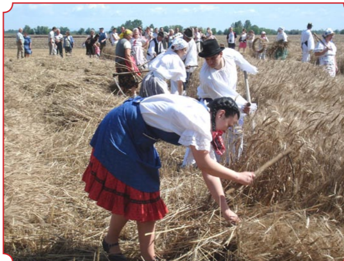
A nyugdíjasklub, a honismereti szakkör tagjai mellett, az idén is arattak fiatalok szép számmal. A szél és a kaszálás kavarta porban jócskán osztoztak a népdalkör tagjai is, akik a nótájukkal buzdították a dolgozókat és a nézelődőket.