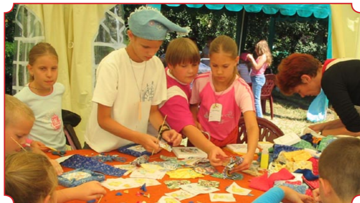
„Varázslatos ügyes kezek” címmel alkotó délelőttiötököt rendezett a Kerek Udvar Kézműves Tár csapata a régi cimboraház udvarán. A kicsik több sátor alatt válogathattak a kézműves mesterségek között, de a két hét alatt akár ki is próbálhattak mindent. Ha elfáradtak, mesét is hallgathattak. A fotón éppen textilképeket kereteznek.