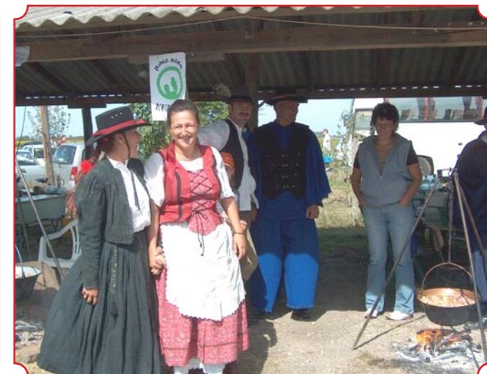
Miközben folyt a munka a búzatáblában, a hatalmas fészer alatt készülődtek az izletes kakaspörköltök. Az idén is eljöttek hozzánk a szomszéd településekről, de Budapestről is a remek bogrács-mesterek. A gyerekek játszóházban foglalkoztak, a színpadon szólt a zene és forgott a sok táncos láb.

Az aratópárok gravírozott poharat kaptak emlékül, a főzők pedig értékes díjakat. A győztes a Kakaspusztító csapata, a II. helyezett a Veszprémi Baráti Kör és Bagi Kakasai csapata lett, a francia és lengyel szakemberekkel kiegészített zsűri szerint. Az idén először, mókás rigmusaikkal is versenyeztek a kakasfőzők. A JABE honlapján a rendezvény szervezőinek fotóit nézhetik meg: www.jabe.hu .