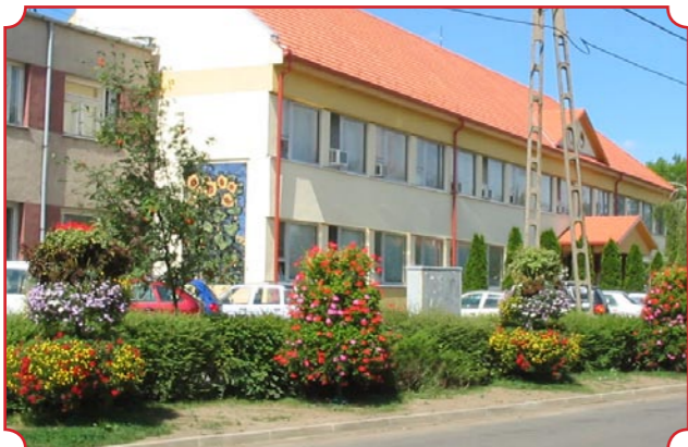
Az új buszváró, a strand területe és a könyvtár előtt gondozott virágtartókat helyeztek ki az Önkormányzat.