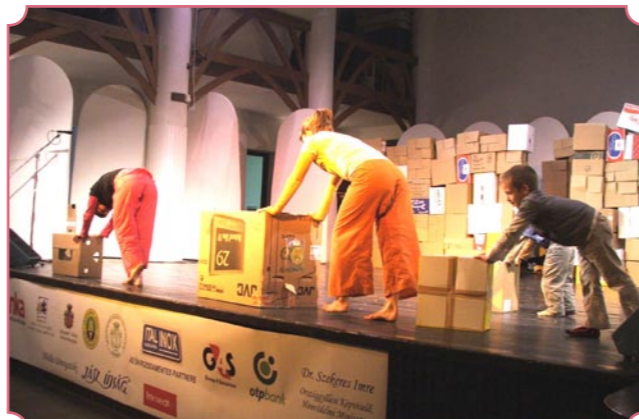
A táncszínház előadása, a népzene és a break-dance egy kicsit szokatlan párosítása volt, maga a darab elgondolkodtató.