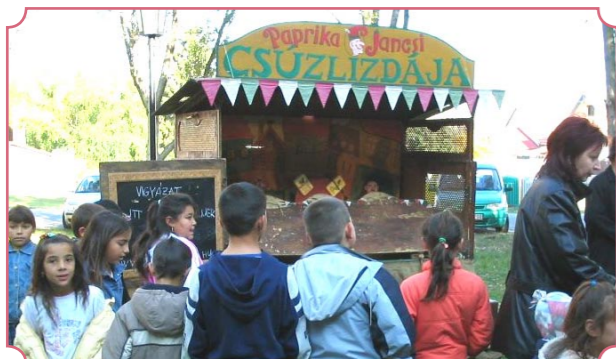
A harmadik nap a gyermekeknek szólt: csuzlizda és bábszínház vonzotta az óvodás és kisiskolás csoportokat a művelődési házba.