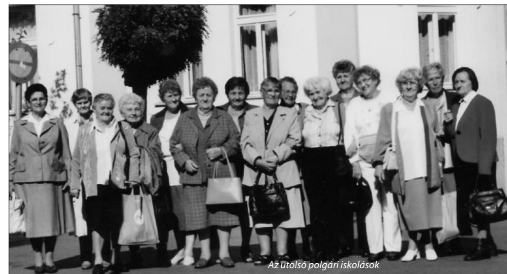
Az utolsó polgári iskolások