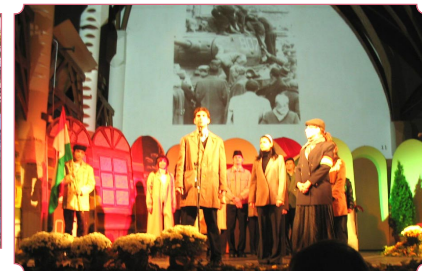
Nagyon szép, megható előadással emlékeztek az JNKSZ Megyei Ipari, Mezőgazdasági, Kereskedelmi Szakképző iskola diákjai 1956 eseményeire, október 23-án a nemzeti ünnep alkalmából.

❖ A JÁSZ ÚJSÁG támogatói: Jászapáti Város Önkormányzata ❖ Az újságban megjelenő hirdetések ❖