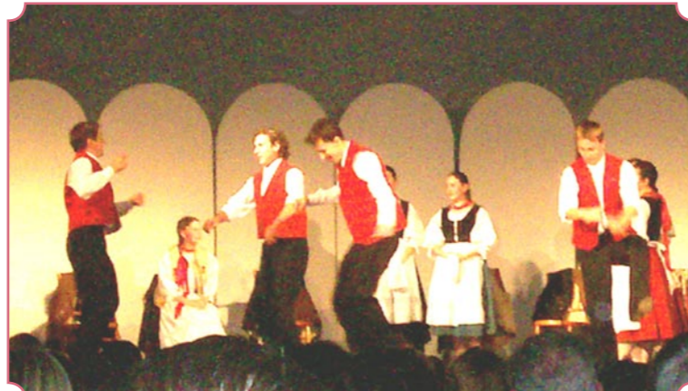
Az Erdélyből érkezett Háromszék Táncegyüttes nagyon színvonalas és látványos műsorral lepte meg a jászapátiakat.