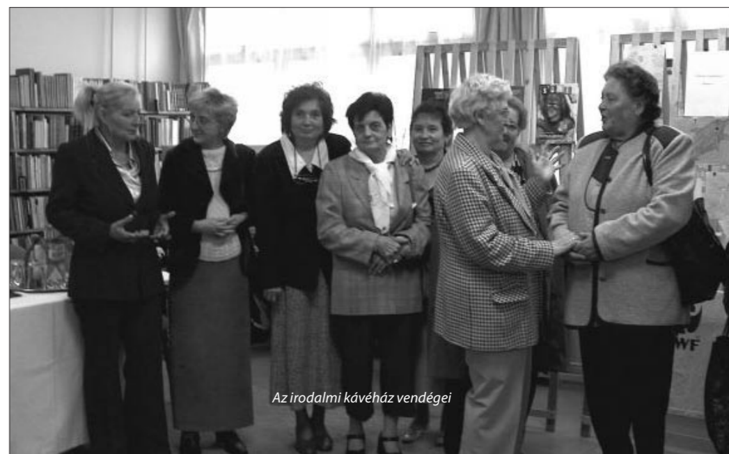
Az irodalmi kávéház vendégei