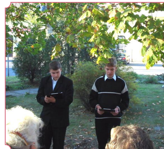
Vágó Pál emlékműsor a szobor előtti parkban az Általános és Alapfokú Művészeti Iskola növendékeivel. A festő halálának évfordulóján a város intézményeinek képviselői koszorút helyeztek el a szobránál és a sírjánál.