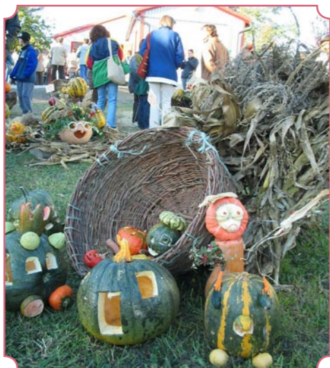
A töklámpás készítő verseny már a hagyományápoló rendezvénysorozathoz kapcsolódott. Ezúttal az MG Barkácsbolt új üzletének udvara adott otthont az őszi termékekből alkotott tárgyaknak és persze a gyerekeknek.