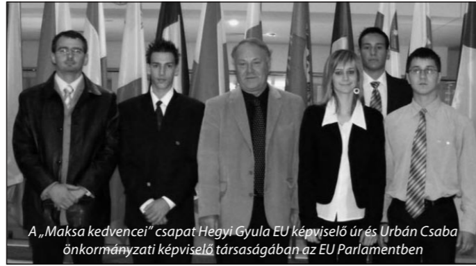
A „Maksa kedvencei” csapat Hegyi Gyula EU képviselő úr és Urbán Csaba önkormányzati képviselő társaságában az EU Parlamentben

12-én látogatást tettünk a képviselő Úr vendégeként az Európa Parlamentben. Folytatólagos parlament munkáról, és betekintést nyerhettünk a döntéshozatali folyamatokba. Délután a Magyar Köztársaság EU Állandó Képviselőjénél egy aktuális környezeti kérdéssel foglalkozó előadást vettünk részt. Ezután lehetőségünk nyílt a város nevezetességeinek megtekintésére és megkóstolhattunk néhány igen kitűnő belga sört, a Grand Place egyik hangulatos kocsmájában. Este Hegyi Úr a csoportot az Ízek utcájában látta vendégül egy különleges vacsorára. Eközben személyesen is beszélgethettünk vendéglátónkkal, aki nagyon örült és büszke volt, hogy egy Európai Unió vetélkedő győzteseit láthat-