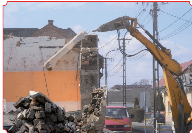
Elkezdődött a városközpontban az új üzlet-lakások építésének előkészítő munkája, a régi épületek bontásával.