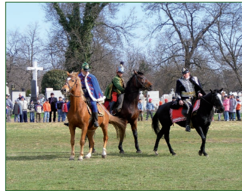
Lovas karusszel. A márciusi nemzeti ünnep alkalmából városunk óvodája, támogatók segítségével, látványos lovas huszár bemutatót szervezett. A vásártéren az óvodások és az alsós általános iskolás diákok megismerhették az 1800-as évek huszár öltözetét, a régi huszárok és lovaik ügyességét. (cikk a 11. oldalon)