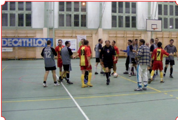
A döntőben résztvevő csapatok üdvözlik egymást a küzdelmek befejeztével. (Írásunk a 11. oldalon.)