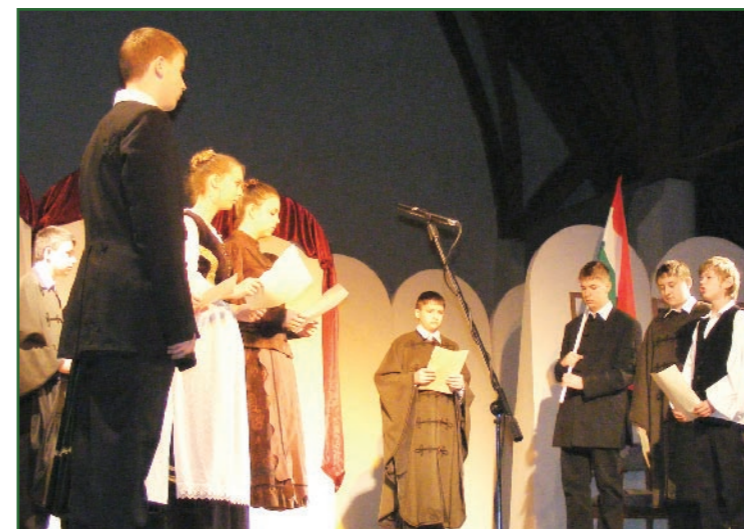
Március 15-én a városi ünnepségen a Jászapáti Általános és Alapfokú Művészeti Iskola diákjainak műsorával ünnepeltük az 1848-as forradalom és szabadságharc 160. évfordulóját.