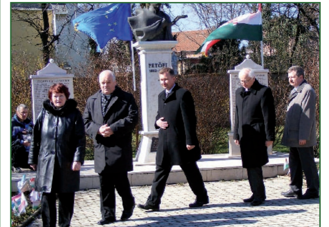
Az ünnepség után a Petőfi szobor koszorúzásán részt vett a lengyel testvérvárosi delegáció is. (Az ünnepi beszédekből részleteket olvashatnak a 2. oldalon.)

* A JÁSZ ÚJSÁG támogatói: Jászapáti Város Önkormányzata * Az újságban megjelenő hirdetések *