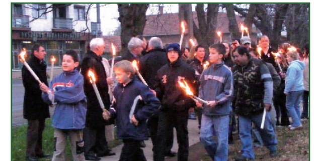
Az általános iskola szervezésében az ünnep előestéjén fáklyás felvonulás volt a Petőfi szobortól indulva a temetőig, ahol a diákok, a lengyel testvérváros, az önkormányzat és civil szervezetek koszorúkat helyeztek el az 1848-as egykori katonák síjára.