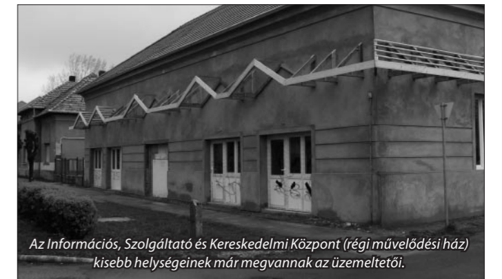
Az Információs, Szolgáltató és Kereskedelmi Központ ( régi művelődési ház) kisebb helységeinek már megvannak az üzemeltetői.

A kivitelező munkák, illetve az üzemeltetés előkészítése jó ütemben halad, és bizakodással várhatjuk az épületek nyári átadását.