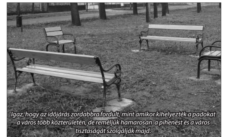
Igaz, hogy az időjárás zordabbra fordult, mint amikor kihelyezték a padokat a város több közterületén, de reméljük hamarosan a pihenést és a város tisztaságát szolgálják majd.