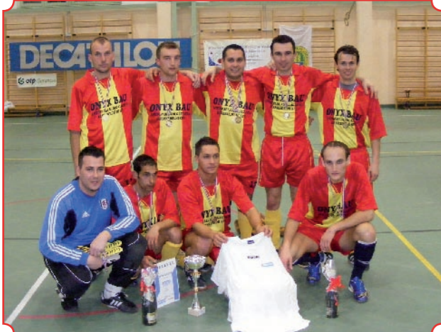
Decathlon kupa első helyezette a díjakkal.