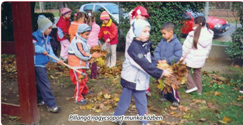
Pillangó nagycsoport munka közben