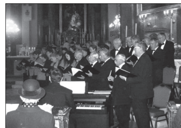
Vendégeink október 23-án délelőtt részt vettek az 1956-os forradalom évfordulójának helyi rendezvényein, koszorút helyeztek el az emléktáblánál, a helyi kórusal együtt közösen énekeltek az ünnepi szentmisén és a városi ünnepségen.

Tartalmas és kellemes napokat töltöttünk együtt, a vendégek és a vendéglátók is jól érezték magukat. Ezúttal köszönjük meg tolmá-