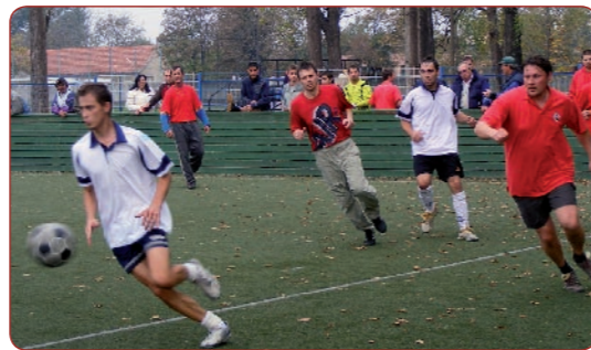
Befejeződött a Kispályás labdarúgó bajnokság a műfüves pályán. A győztes az ONYX BAU Kft csapata lett. December 27-én teremtorán mérik össze erejüket a gimnázium tornacsarnokában, reggel 9-től.