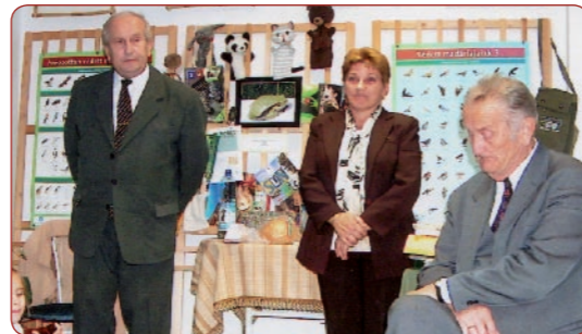
Megnyílt az új Zöld Pont Iroda. (Teljes cikk a 6. oldalon.)