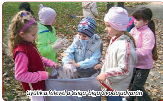
Gyűlik a falevél a Csiga-biga Óvoda udvarán