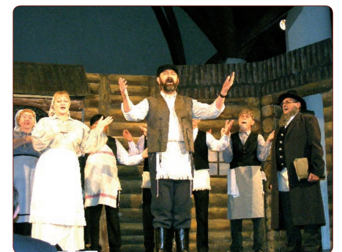
Nagy sikerrel mutatta be városunk színjátszó köre új darabját: a HEGEDŰS A HÁZTETŐN című musicalt.

* A JÁSZ ÚJSÁG támogatói: Jászapáti Város Önkormányzata * Az újságban megjelenő hirdetések *