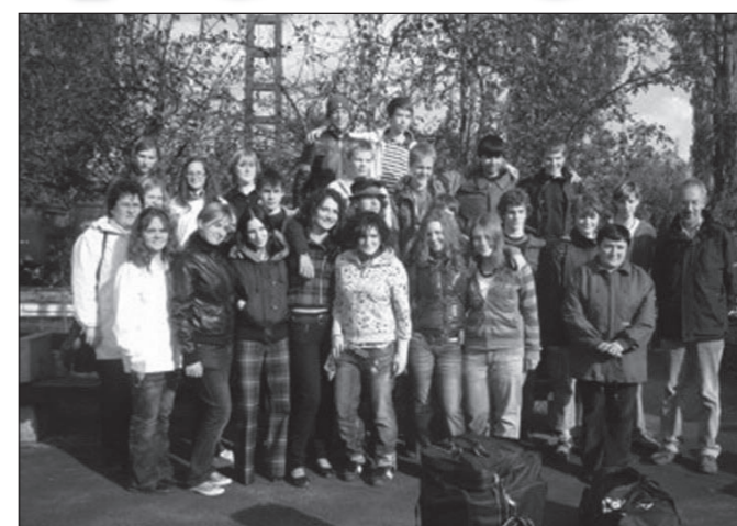
A magyar és a német diákok jövőre Németországban találkozhatnak.

2008. szeptember 19-én délelőtt vonattal érkeztek. Az összes magyar vendéglátó nevében elmondhatom, hogy rendkívül kellemesen csalódtunk bennük. Már az első pillanatban szimpatikusak, barátságosak voltak. Minden érdekeltet őket, nagyon figyelmesen bántak velünk. Miután mindenki megtalálta saját vendégét, otthon igazi magyaros vacsorával kínáltuk őket. Már aznap összegyűltünk és ebből sokást teremtve minden este jókat buliztunk.