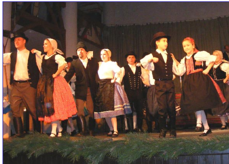
A Hétszínvirág Néptáncgyűttes Karácsonyi műsora. A táncosok az idén is különösen látványos színpadképpel, nagyszerű előadással köszöntötték a szép ünnepet.