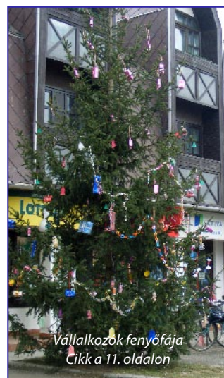
Vállalkozók fenyőfája Cikk a 11. oldalon

Ebben az évben is egy gyönyörű fenyőfát állítottak fel a főtéren városunk vállalkozói. Az óvodások sok szép díszet készítettek azért, hogy a karácsonyfa valóban ékessége legyen a térnek. A legkisebbekhez a Szentestét megelőzően már ellátogatott a Jézuska, és a hozzájárulásból megmaradt összegből, játékokkal lepte meg az óvodákat.