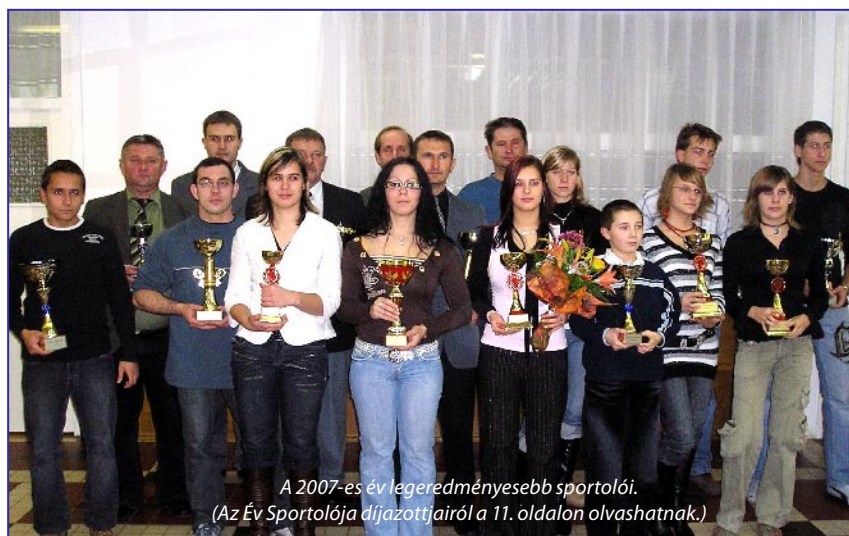
A 2007-es év legeredményesebb sportolói. (Az Év Sportolója díjazottjairól a 11. oldalon olvashatnak.)

Ebben az évben is egy gyönyörű fenyőfát állítottak fel a főtéren városunk vállalkozói. Az óvodások sok szép díszet készítettek azért, hogy a karácsonyfa valóban ékessége legyen a térnek. A legkisebbekhez a Szentestét megelőzően már ellátogatott a Jézuska, és a hozzájárulásból megmaradt összegből, játékokkal lepte meg az óvodákat.