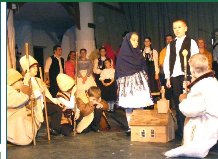
A Hétszínvirág Néptáncgyűttes karácsonyi műsorában a legfiatalabbak betlehemes játékot adtak elő a művelődési ház színpadán.