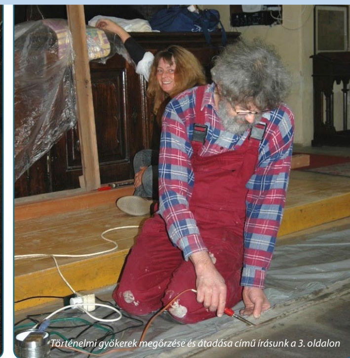
Történelmi gyökerek megőrzése és átadása című írásunk a 3. oldalon