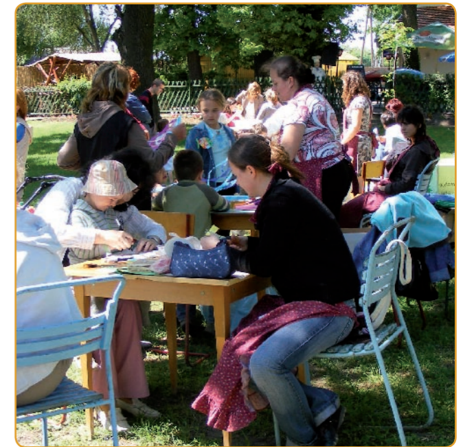
Pünkösöd vasárnapján új kezdeményezésként, először rendeztek Gyermeknapot a Tölgyes Strandfürdőben. A bohócok műsora, a kézműves játékok, az íjászat mellett a gyerekek a strand kellemes vizét is élvezhették.

* A JÁSZ ÚJSÁG támogatói: Jászapáti Város Önkormányzata * Az újságban megjelenő hirdetések *