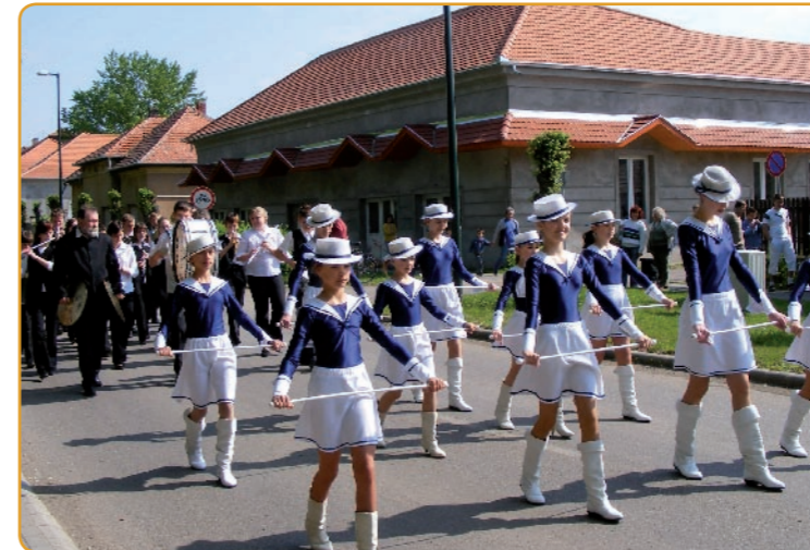
Május elsején már hagyományosan a mazsorettek és a fúvószenekar felvonulásával kezdődött a majális.