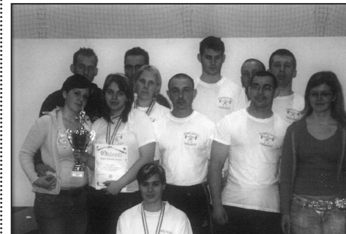
A Family SC. idej első versenyének résztvevői.

Túl vagyunk az év első versenyn. A felnőtt erőemelő magyar bajnokságon. Ez a verseny Orosházán került megrendezésre 2008. 04. 11-13-án. A Jászapáti Family S.C. csapatunk 9 fővel nevezett erre a rangos eseményre. 3 női és 6 férfi indulóval. Először a lányok versenyével kezdeném: