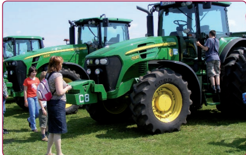
A gyerekek és felnőttek élvezettel próbálták ki a kiállított régi motorokat és az új traktorokat.