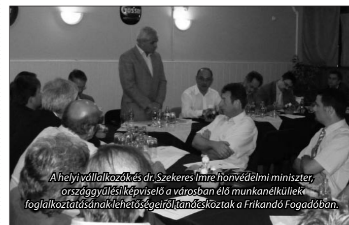
A helyi vállalkozók és dr. Szekeres Imre honvédelmi miniszter, országgyűlési képviselő a városban élő munkanélküliek foglalkoztatásának lehetőségeiről tanácskoztak a Frikandó Fogadóban.