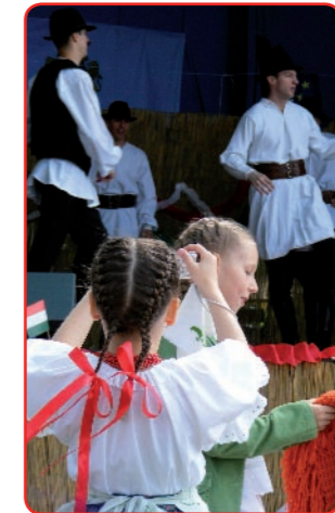
A színpadon az iskolások és táncosok műsorai követték egymást az év első szabadtéri rendezvényén