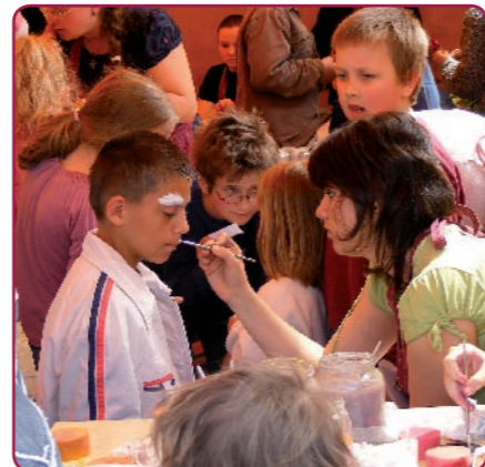
Május 3-án és 4-én a kellemes jó időben rengetegen látogattak ki az Agrocentrum előtti területre, ahol a gyerekek szórakozásáról is gondoskodtak