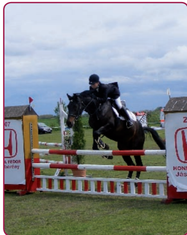
A díjugrató és fogathajtó verseny már hagyományosan a kétnapos rendezvény része.