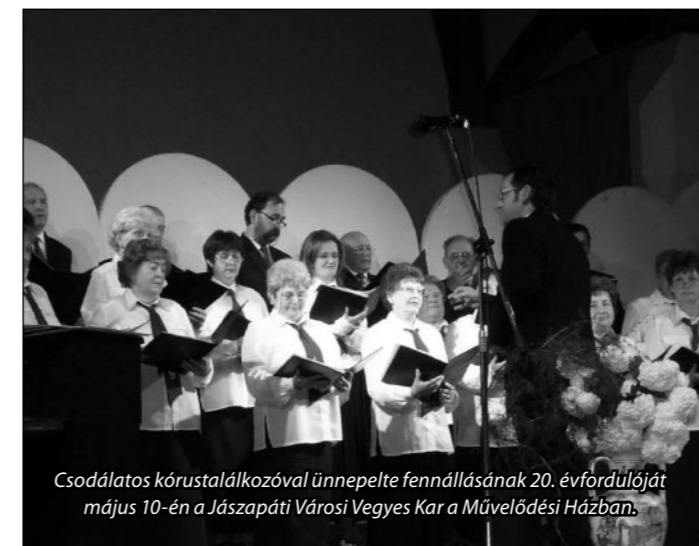
Csodálatos kórustalálkozóval ünnepelte fennállásának 20. évfordulóját május 10-én a Jászapáti Városi Vegyes Kar a Művelődési Házban.

(A beszámolót a Muskátli Népdalkör vezetője készítette.)