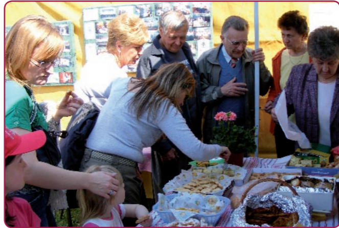
Az idén is nagy sikere volt a régi recept szerint készült sütemények kóstolójának, amit a városban működő nyugdíjasklubok, a honismereti szakkör és a Muskáti népdalkör tagjai készítettek.