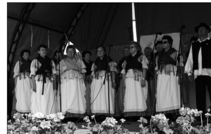
A muskátli Népdalkör a Gazdanapok megnyitóján.

Nagyon eseménydúsán telt el a május hónap a Muskátli Népdalkör életében.