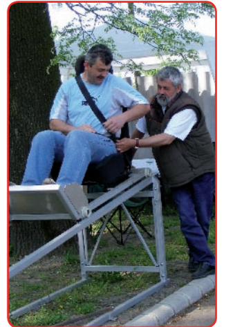
Az idén gépjármű biztonságtechnikai bemutatót is rendeztek, a képen egy szerkezettel a 20km sebességű ütközést lehetett „kipróbálni”.