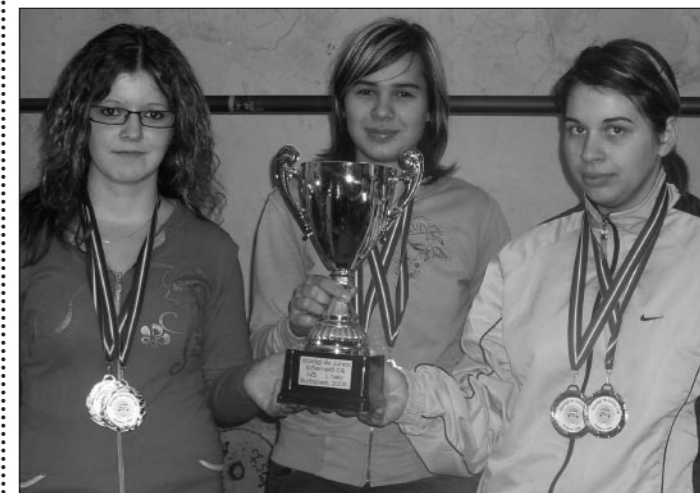
A Família sc leány csapata

Magyar bajnokságot nyert a Família sc leány csapata