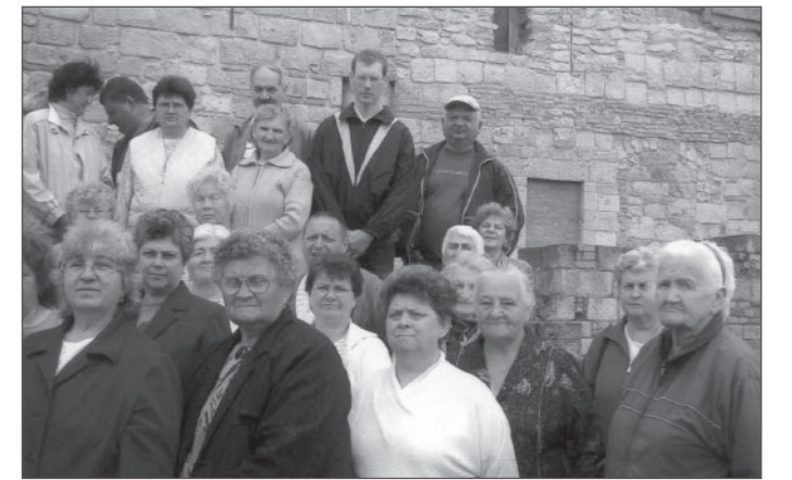
Kiránduláson az egyesület tagjai

Szeptember 27-én tartottuk a fogyatékosok napi ünnepséget,