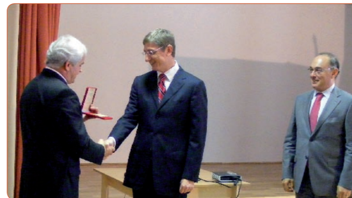
Az ünnepélyes átadáson Gyurcsány Ferenc miniszterelnök adta át az épületek kulcsait Szabó Lajos polgármesternek.