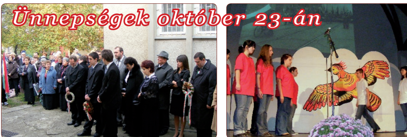
Október 23-án az emléktáblánál, a helyi közösségek és a vendég francia kórustagok együtt helyezték el koszorúkat.