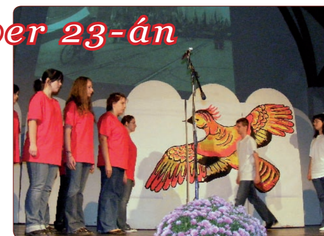
A gimnázium diákjai szép műsorral idézték fel az 56-os eseményeket, és emlékeztek a hősiökre.