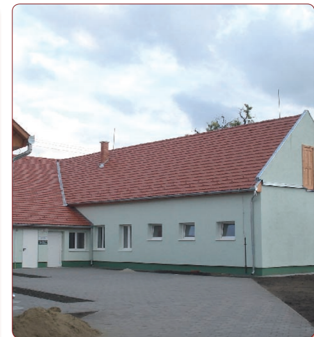
A régi munkáskör, később csirkeketető épületben (Aradi utca 1.) októbertől Humán Fejlesztő és Foglalkoztató Központ működik.