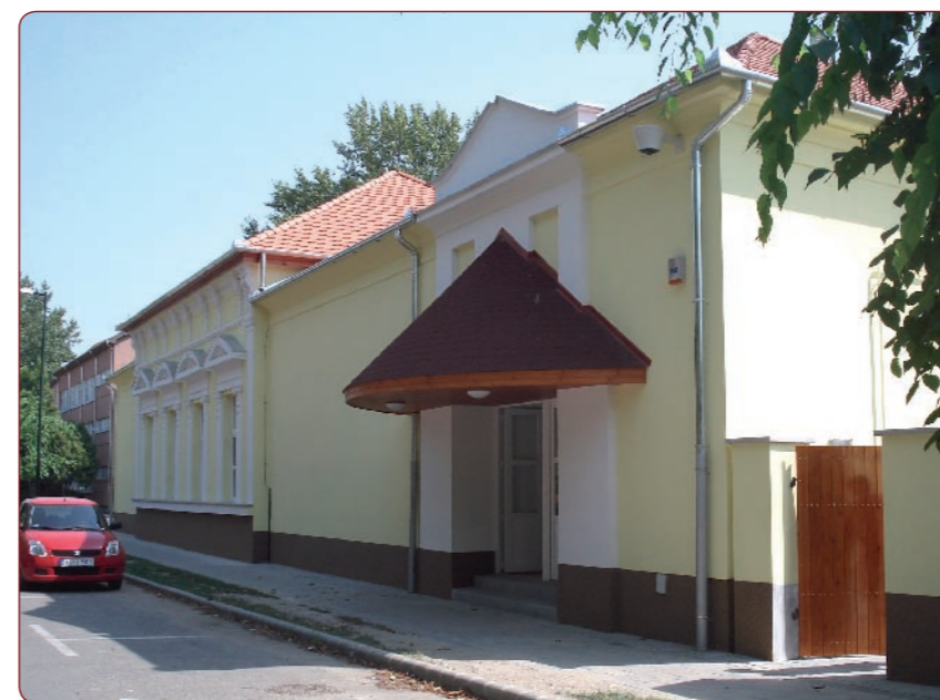
A megújult úri kaszinó, volt mozi épülete a Damjanich út 4 szám alatt, ma Művészetek Háza.