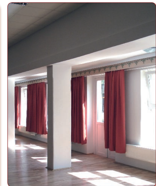
A nagyterem új arca a Művészetek Házában.