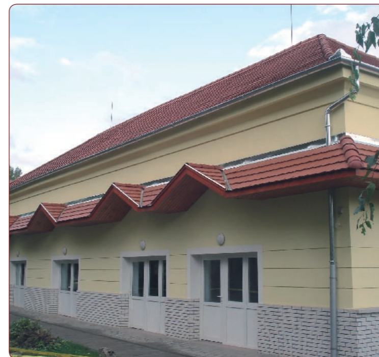
A régi művelődési házból a felújítás után Információs és Kereskedelmi Központ lett.