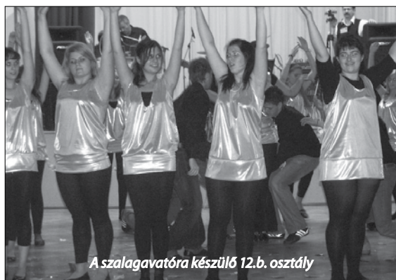
A szalagavatóra készülő 12. b. osztály

Olyan jó volt néhány óráig: visszamentünk az időbe, az iskolába, ahol diákok voltunk,