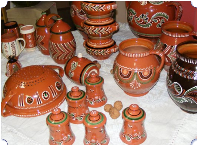
Nagyné Török Zsóka fazekas népi iparművész munkái.