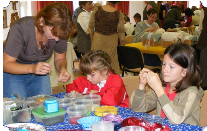
A kézműves foglalkozásokon nagyon sokféle hagyományos szakmát kipróbálhattak az érdeklődők, nemcsak gyerekek.