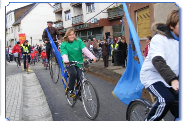
A kerékpárút próbája.