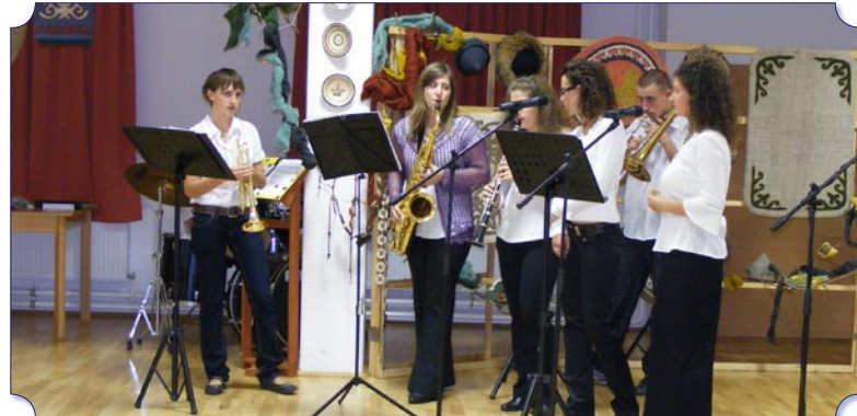
Az Ötösfogat zenekar a rendezvény nyitó napján. A Rácz Aladár zeneiskolásokból alakult együttes többnyire mulatós zenét játszik, lakodalmakon, osztálytalálkozókon, de szerenádokat is adtak már.