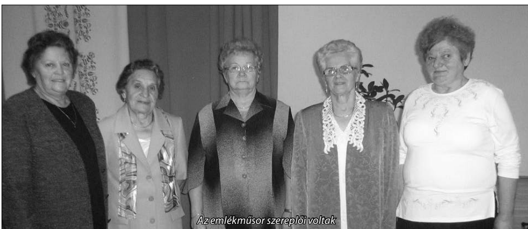
Az emlékműsor szereplői voltak

A hetvenes évek elején igény merült fel a beteg, egyedül élő személyek gondozására. 1975 május 1 – től területi gondozói szolgálatot hoztak létre. Két gondozónő látta el a munkát. 15 – 20 olyan főnek nyújtottak segítséget, akik otthonukban nem, vagy csak nehézségek árán tudták az életvitelüket fenntartani.