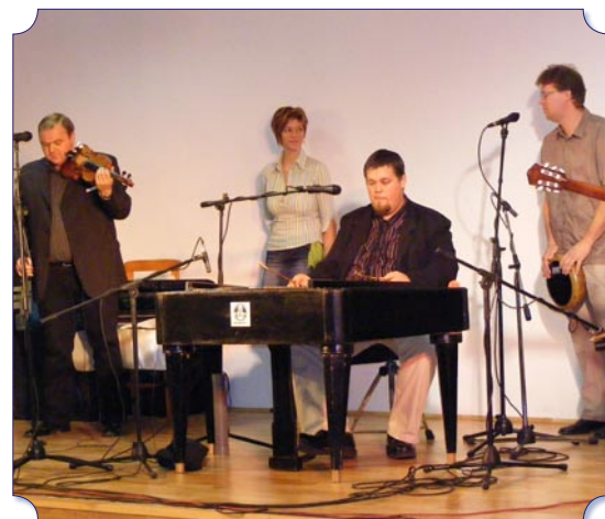
A Cimbaliband kitűnő hangulatú koncertje zárta a rendezvénysorozatot. Dalaik közös jellemzője, hogy bennük a különböző népek zenéi nem pusztán önmagukért beszélnek, inkább építőkövei egy sajátos, egyszerre archaikus és modern hangzásvilágnak.