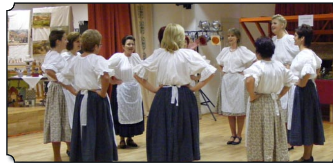
Ünnepséggel és kiállítás rendezésével emlékeztek az óvoda egykori alapítóira, a mai óvónók. (Teljes cikk a 6. oldalon.)