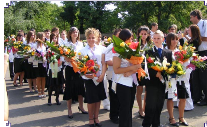
Búcsú az iskolától. A Jászapáti Alapfokú és Művészeti Iskola tanévzáró ünnepségén a nyolcadikosok ballagásával kezdetét vette a nyári vakáció.

JÁSZAPÁTI ÉS KÖRNYÉKE FÜGGETLEN HAVILAPJA * XX. ÉVFOLYAM * 7. SZÁM * 2009. JÚLIUS HÓ