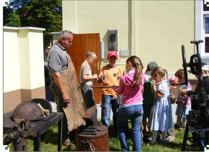
A Barangoló című ismeretterjesztő gyermekfoglalkozás júniusi programjában többek között a kovácmesterséggel is megismerkedtek a kicsik.