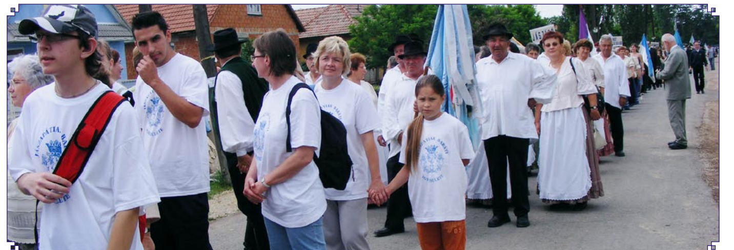
Városunkat a Jászok Világtalálkozóján a nyugdíjs klubok, az énekkar, a JABE és kerékpáros csapata képviselte népes delegációval.