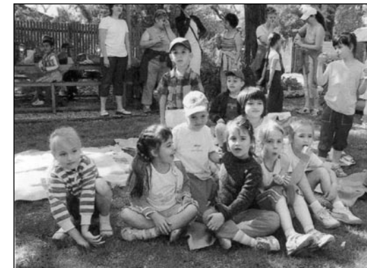
Vidám nap a tanyán