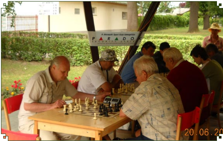
A Tölgyes Sportnapok keretében sakkversenyt is rendeztek a strandon. A versenyről is olvashatnak a 6. oldalon.