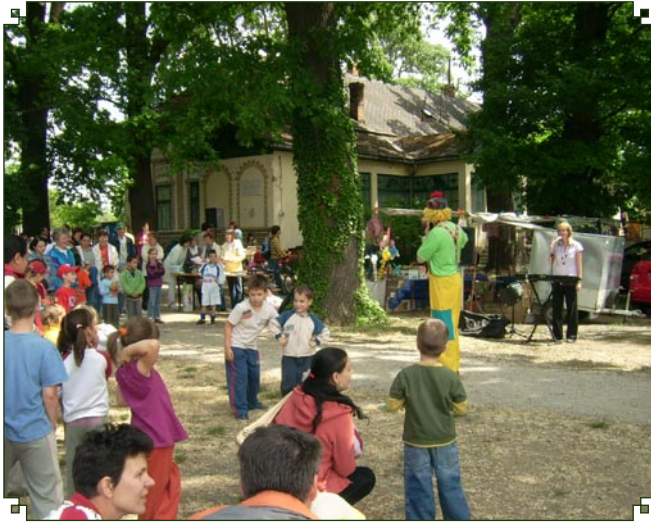
Az Önálló Óvodai Egység és a Városi Könyvtár és Művelődési Központ dolgozói május 30-án ebben az évben is megrendezték Jászapátin a Gyermek Napját.