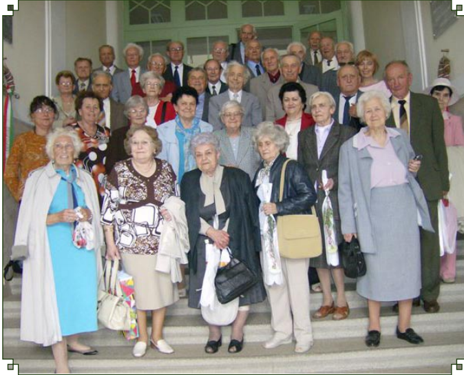
Hatvan éves érettségi találkozó volt a gimnáziumban. (Teljes cikk a 8. oldalon.)