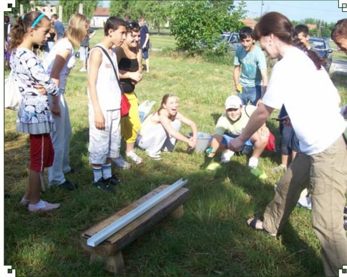
Honvédelmi nap az általános iskolában. (Teljes cikk az 5. oldalon.)