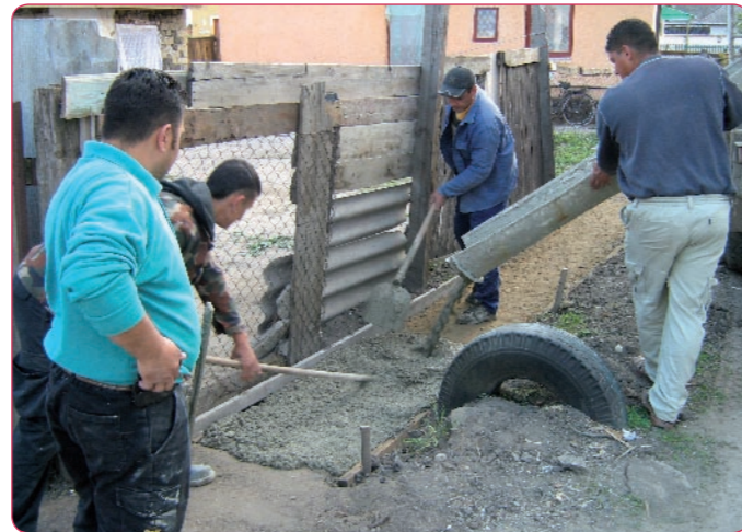
Közmunkások betonjárdát építenek a városban. A tervek szerint 1500-2000m járda fog megújulni munkájuk során.