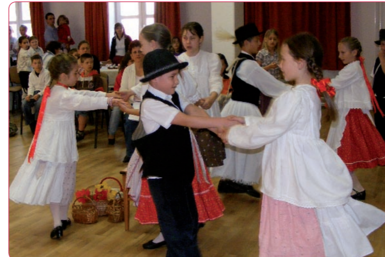
A „Barangoló” című komplex ismeretterjesztő gyerekfoglalkozás sorozat második részében a húsvéti ünnepkörrel ismerkedhettek a kicsik, verssel, mókával, zenével, táncal, kézműves foglalkozásokkal és persze tojásfestéssel – a Művészetek Házában Legközelebb május 9-én lesz Jászsági Barangolás.