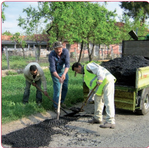
Aszfaltozás a közmunka program keretében