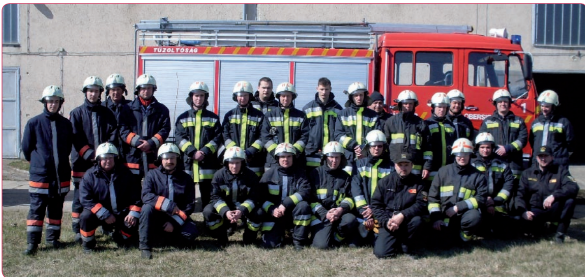
Nemrégiben nagyszabású gyakorlat került megrendezésre a TIG jászapáti telepén. A gyakorlatnak része volt a tűzoltás mellett a füstben történő személykeresés és mentés. A gyakorlaton a jászapáti, jászkiséri, jászberényi és hevesi tűzoltók vettek részt, és ezzel a viszonylag fiatal állománnyal találkozhat a lakosság éles bevetéseken is. (teljes cikk a 6. oldalon.)

* A JÁSZ ÚJSÁG támogatói: Jászapáti Város Önkormányzata * Az újságban megjelenő hirdetések *