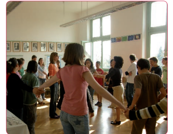
Erdélyi, francia és lengyel táncokkal és ételekkel ismerkedhettek meg az érdeklődők.