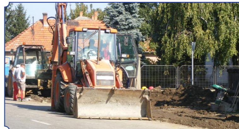
A hónap végére el is készül.