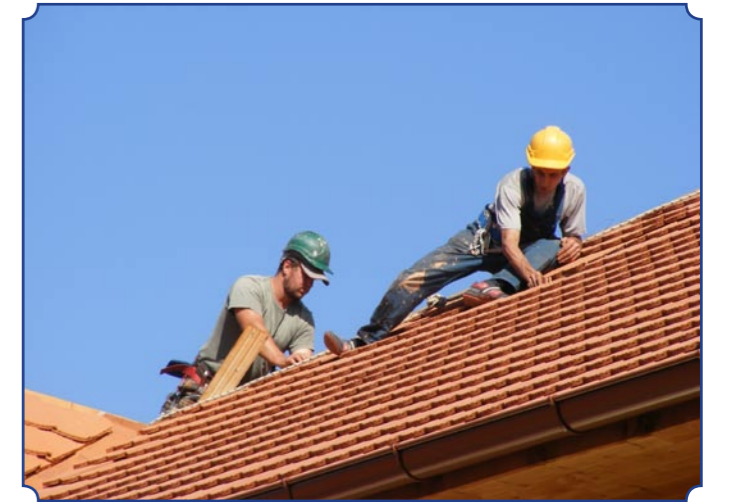
Utolsó simítások a polgármesteri hivatal épületének felújításán. A mozgássérültek számára új akadálymentes bejáratot alakítanak ki. Az energiatakarékosság jegyében hőszigetelt falak, ablakok és napkollektor készül, az összegyűjtött csapadékvíz a zöldfelületek locsolásánál hasznosul majd.