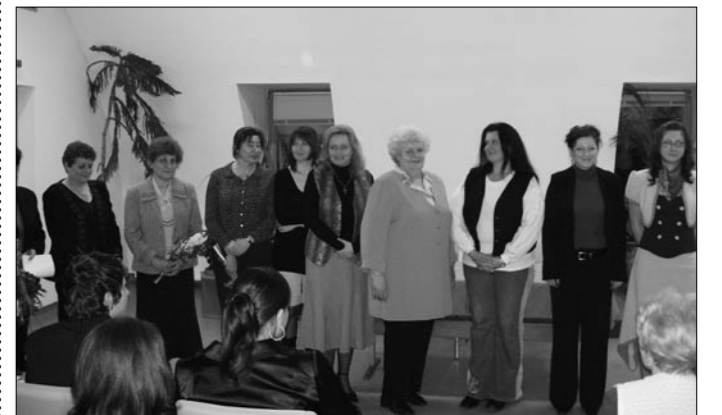
A kiállítók és tanáraik