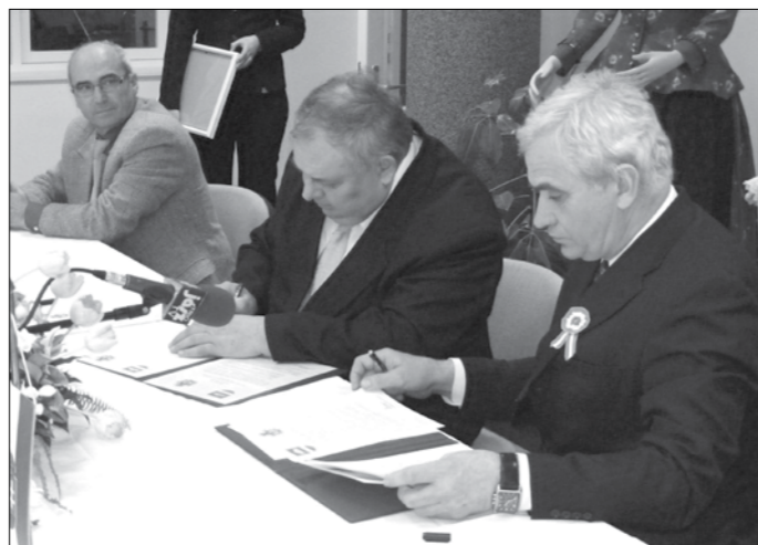
A két polgármester aláírta a testvér-települési megállapodást.

A falu sokat szenvedett a háborúktól – többször el is pusztult. 1848-ig az esztergomi érsek birtoka volt. A szabadságharcból a kéméndiek is kivették részüket. Sokszor olvashatunk az 1849-es dicső tavaszi hadjárat győzelmes állomásairól: Hatvan, Isaszeg, Vác, Nagysalló, Komárom nevei mellett viszont alig-alig esik szó a jelentős és sok emberáldo-