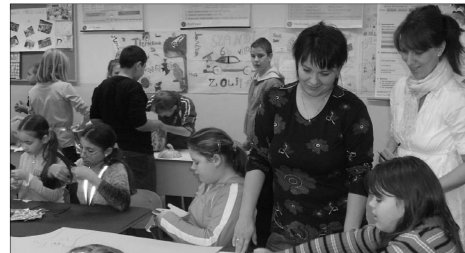
Halloween hét az iskolában

Minden épületünk jó állapotban van, a tantermek felszereltsége kiváló, már most szinte minden tanteremben van számítógép, a következő tanévben pedig - egy már megnyert pályázatnak köszönhetően - minden tanulócsoportnak lesz laptopja, projektora és interaktív táblája, korlátlan internet elérhetőséggel.