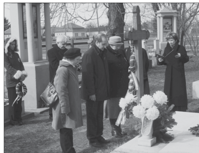
Koszorúzás az egykori 48-as huszárok sírjánál a temetőben.

Kellemes húsvéti ünnepeket kívánunk minden kedves olvasónknak!