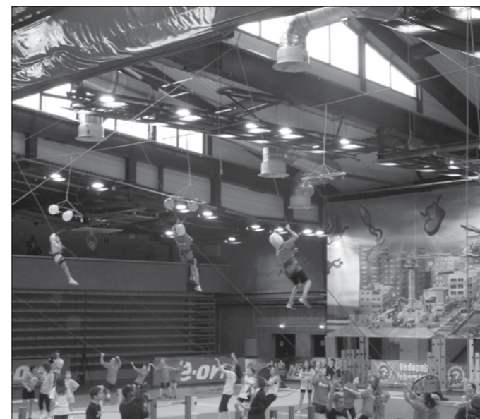
Az egyik feladat része a kötélmászás volt.