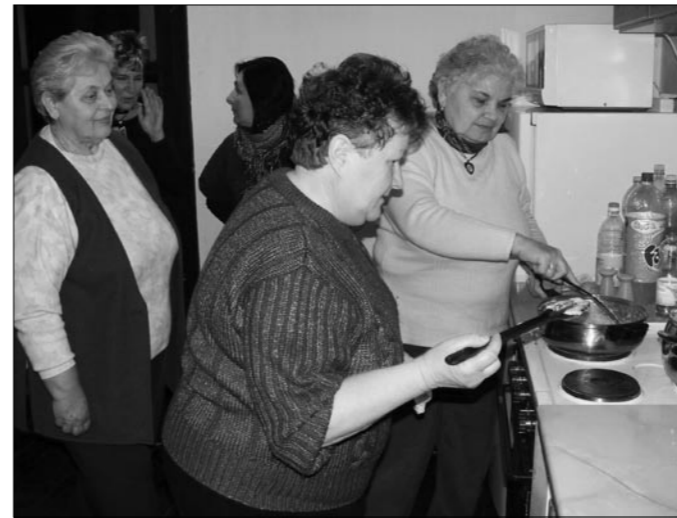
Készül a császármorzsa

Néhány éve már, hogy a művelődési házban főzőklub működik.