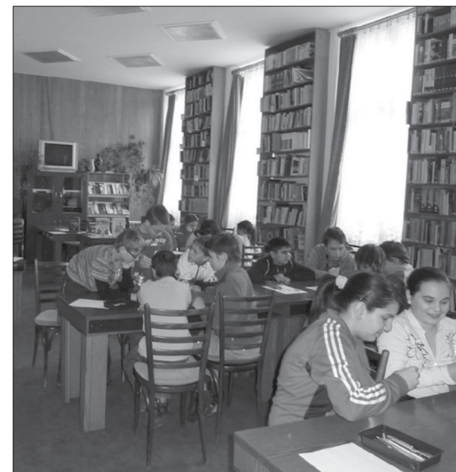
Játékos történelemóra a könyvtárban

szédét hallgatták meg. A döbbenetet, hogy maga Kossuth Lajos szövegezték 120 év távlatából. Úgy érzem ezzel sikerült közelebb hoznom hozzájuk március üzenetét. A másik rendhagyó szempont véleményem szerint az volt, hogy nemcsak a március 15-i eseményekre koncentráltam, hanem az események megértésért igyekeztem bemutatni a reformkori előz-