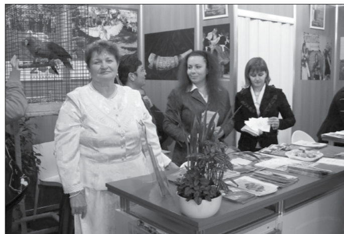
A Jászság standja az Utazás kiállításon.

Jászság község önkormányzata és a Jászok Egyesülete közösen rendezte idén a XVI. Jász Világtalálkozót. A rendezvény időpontja 2010. június 11-12-13, amikor is színvonalas programmal várják az itthon élőket és elszármazottakat egyaránt.