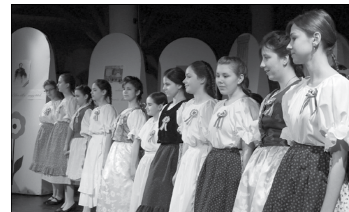
Ünnepi műsor az általános iskola Drámajátékos szakkörének előadásában.

Kellemes húsvéti ünnepeket kívánunk minden kedves olvasónknak!