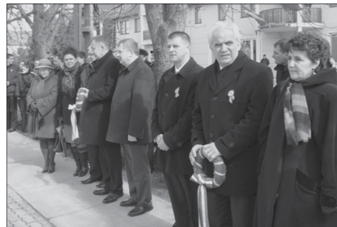
Jászapáti város önkormányzata és a lengyel testvérvárosi küldöttség együtt emlékezett 1848. március 15-re.