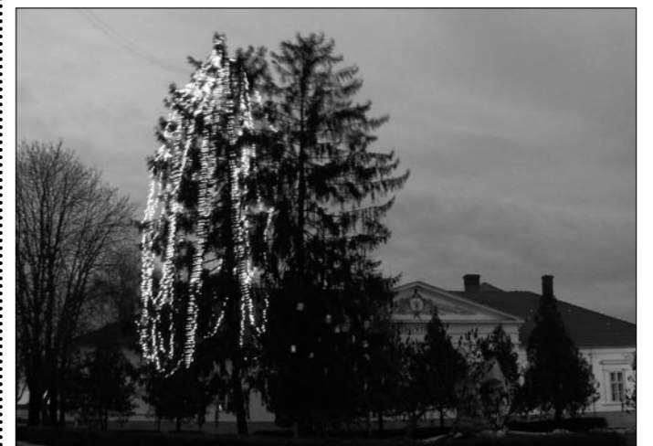
A Vállalkozók fenyőfája az idén élő örökzöld fa volt a könyvtár előtt.