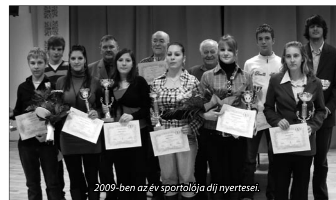
2009-ben az év sportolója díj nyertesei.

A Kigyó Dojó Harcművészeti Sportegyesület tagjaként az elmúlt évben a Kempo Európa Kupán valamennyi dobogós helyezésből szerzett egy érmet illetve 7 országos bajnoki címmel és 2 országos kupa első hellyel dicsekedhet.