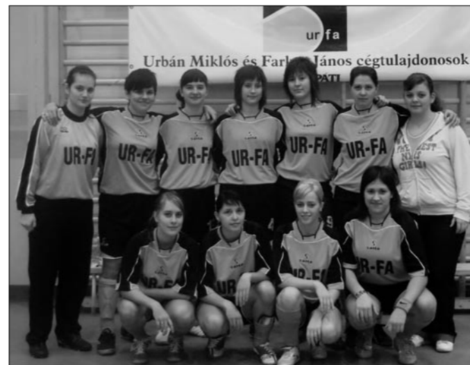
Női focicsapatunk az Fc.Incognito