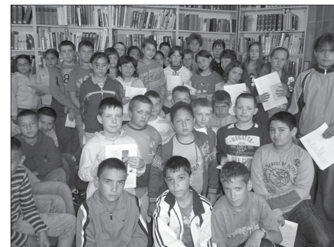
A gyerekek a könyvtár szünidei foglalkozására belépőt nyertek.