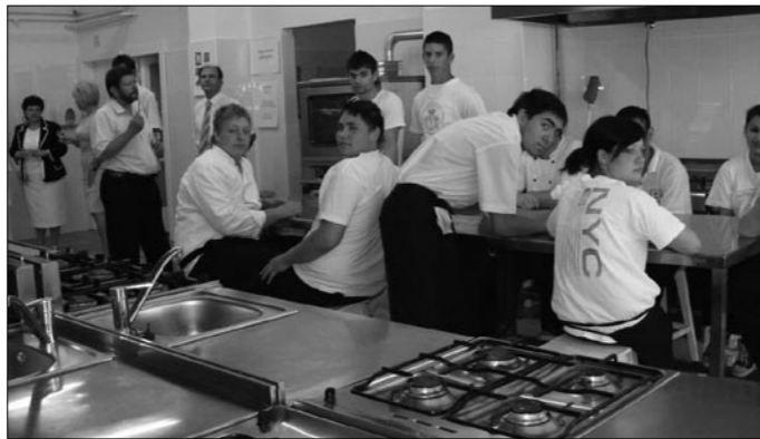
Tankonyha – munka után