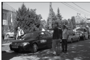
A megyei polgárőr akcióhoz csatlakozva Jászapátiról is indult segélyszállítmány az árvíz sújtotta térségbe.