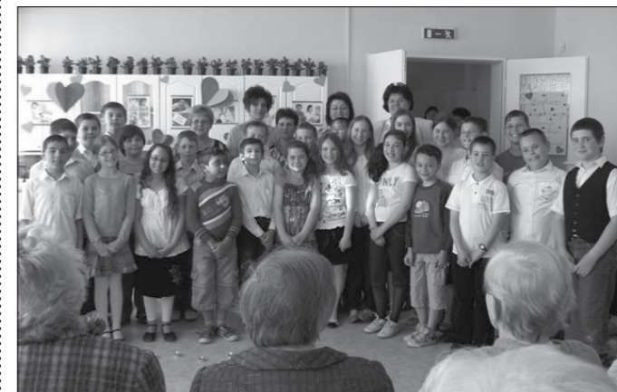
Anyák napja az idősek otthonában

A „Fehér Akác” Idősek Otthonának lakói már évek óta kedves ismerősként fogadják a Jászapáti Alapfokú Művészeti Iskola tanulóit a különféle ünnepi alkalmakkor.