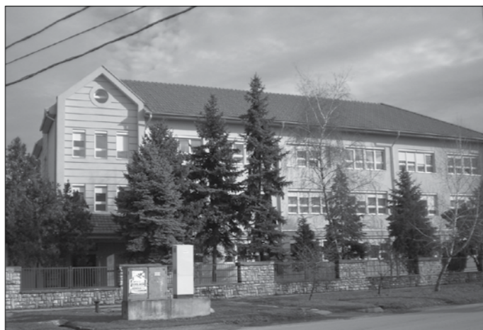
A március 25-én átadott Juhász Máté úton lévő telephelyünk 94 férőhelyes, 2-4 ágyas lakószobáival, társalgókkal, teakonyhakkal, imateremmel szolgálja az idősek kényelmét. A szabadban való tartózkodás lehetőségét biztosítja a kényelmes kerti bútorokkal berendezett belső udvarunk.

Az idősothtoni ellátás csak meghatározott gondozási szükséglet fennállása esetén vehető igénybe. Az ellátást igénylő személy gondozási szükségletének vizsgálatát az Országos Rehabilitációs és Szakértői Intézet (ORSZI) szakértői bizottsága vizsgálja, és adja ki a kötelező érvényű szakvéleményt. Idősothtoni ellátás 2008. január 1-től napi 4 órát meghaladó, illetve – a külön jogszab-