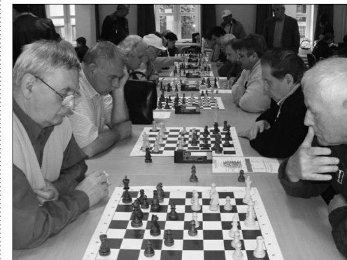
Ilyen nagy létszámú sakkverseny még nem volt a városban, mint május 16-án, az első megyei csapatversenyen.