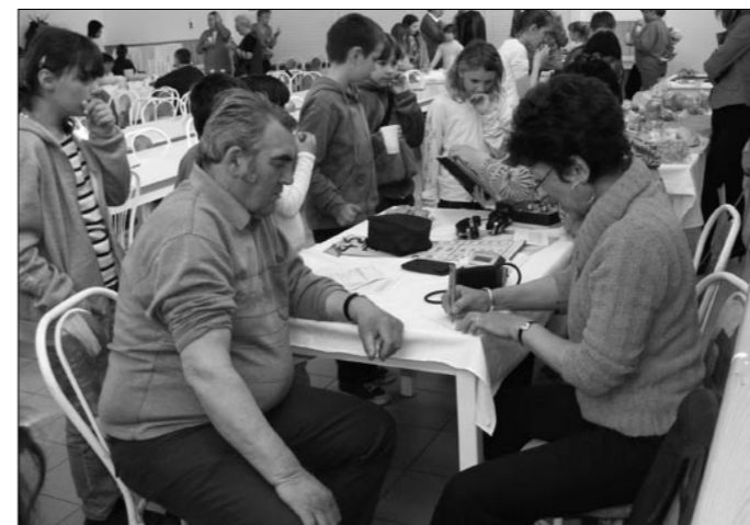
Vérnyomásmérés és tanácsadás a védőnőkkel a felnőttek részére, közben a gyerekek teszt feladatokat oldottak meg.