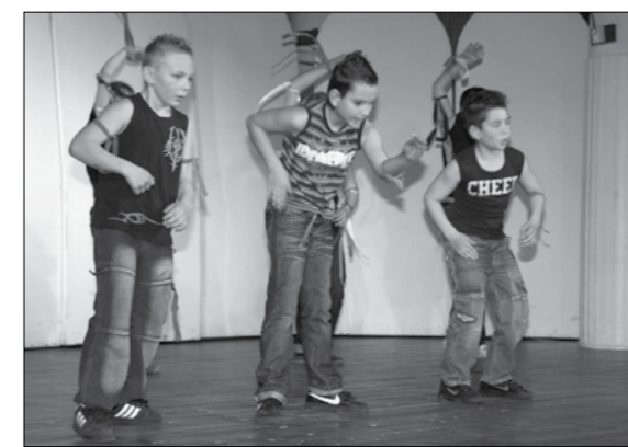
Képek az általános iskolás tátikáról.

Az ismertett művek inkább a mai fiatalság ízlésének feleltek meg, de az iskolai kötelező olvasmányról is készült könyvajánló.