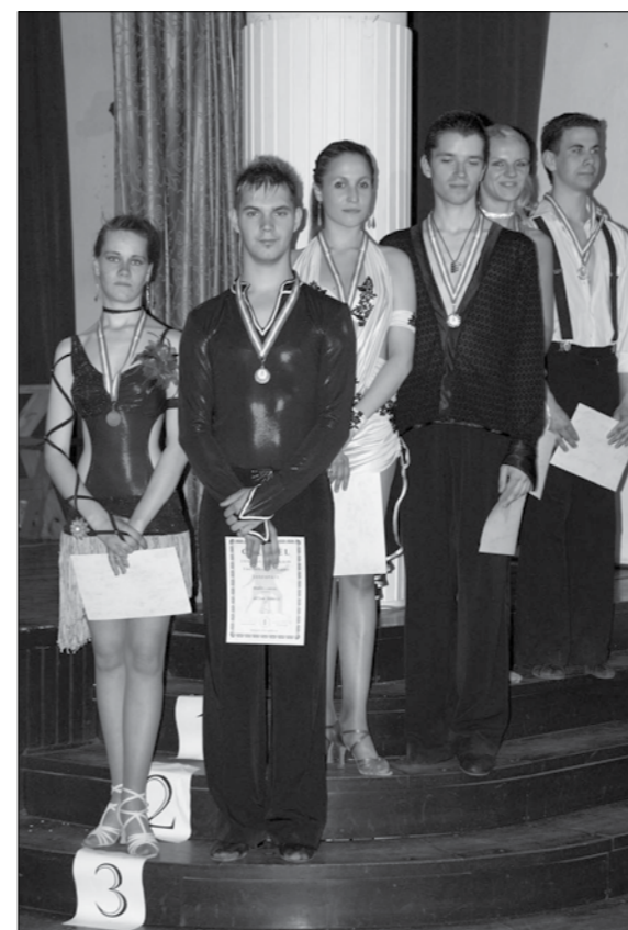
A művelődési ház már 3. alkalommal rendezte meg a regionális táncversenyt, salgótarjáni, érdi, szentesi, szolnoki, stb. versenyzőkkel. A rendezvényt támogatta a Jászkör Egyesület és a Jászapáti 2000 MG Zrt. is.