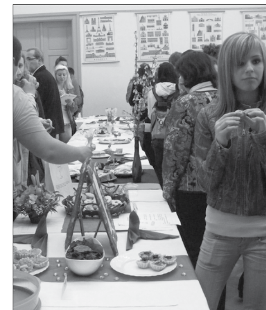
A népi sütemények próbája és a kóstolás volt.