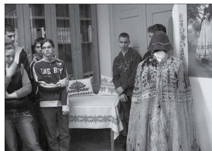
Jász hímzéssel díszített használati tárgyakat és eredeti szűrt is láthattak a fiatalok.

A jezsuita rend feloszlása után, Mária Terézia váci kanonokká és királyi tanácsosává nevezte ki. Részt vett a magyar közoktatásügy újjászervezésében is. 1777-ben a nagyszombati egyetem Budára költözésekor a bölcsészeti kar igazgatójává nevezték ki, e tisztségét haláláig betöltötte.