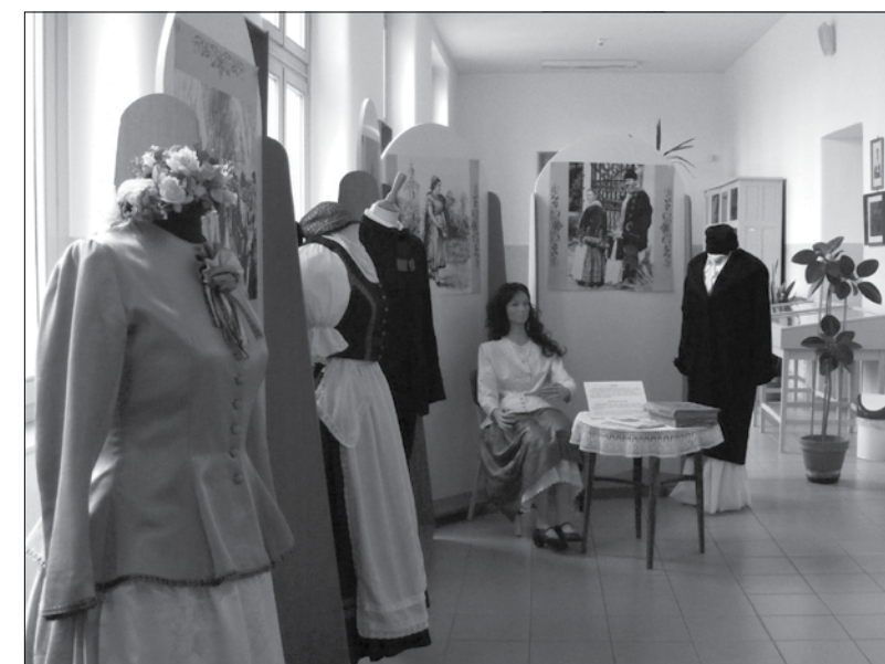
Jász viselet kiállítás az iskola folyosóján.