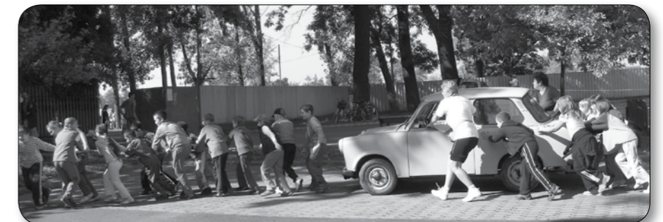
Szeptember 22-én mégsem volt teljesen „autó mentes” a nap a gyerekeknek - de a Trabantot csak tolni kellott, így nem szennyezte a levegőt. További képek az Autómentes napról a 9. oldalon.

Tisztelt Partnereink! Cégünk integrátori tevékenység végzésével több évtizedes tapasztalatra alapozva segíti az Ön mezőgazdasági tevékenységét vetéstől az értékesítésig.