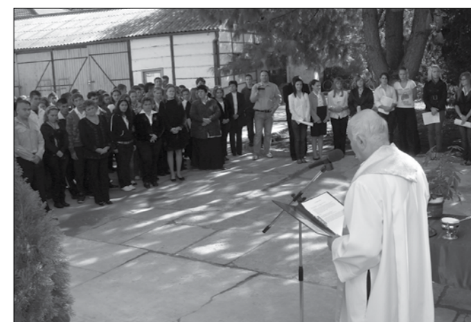
Papi áldással vették át a felújított épületet a diákok.

A projekt alapvető célja, az energiahatékonyság és az energiatakarékosság fokozása a termelés, elosztás, szállítás és a végfelhasználás területén. A szakiskolai oktatás tanügyi épületének komplex energiaraționalizálási elemei között szerepelt az épület