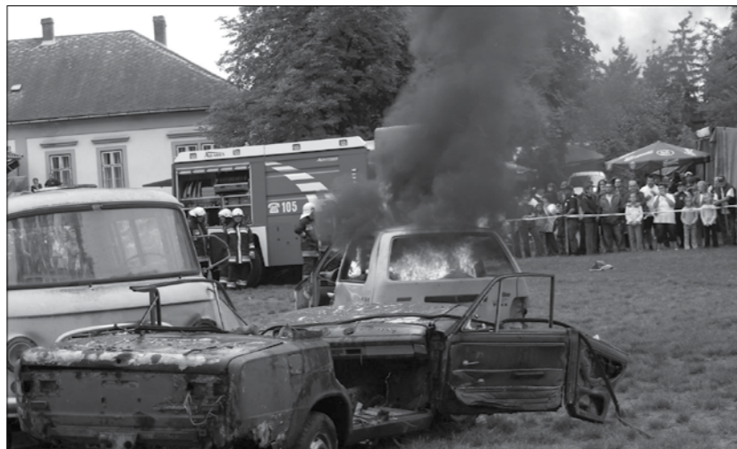
Látványos tűzoltó bemutató a Polgárőr családi napon, Pusztamonostoron.