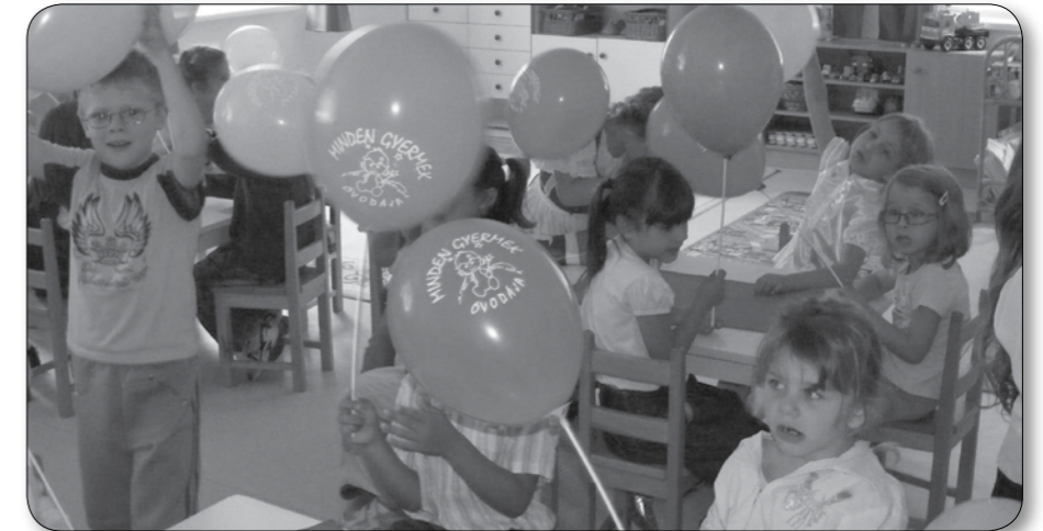
Nyílt nap a Szivárvány óvodában. (Teljes cikk a 2. oldalon.)