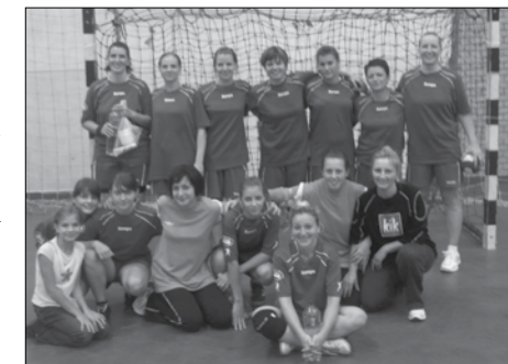
a kézilabdás lányok

A következő forduló október 3.-án a Martfűi Sportcsarnokban kerül megrendezésre ahol 10 órától a tavalyi bajnok Törökszentmiklósi KE és 13 órától a 6. helyezett Jászfényszaru VSE várja lányainkat egy-egy összecsapásra.