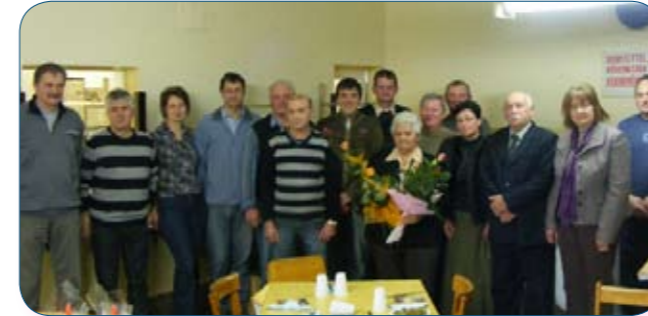
A Városi Vöröskereszt kitüntetett tagjai. Véraladókát köszöntöttek című írásunk a 3. oldalon.

JÁSZAPÁTI ÉS KÖRNYÉKE FÜGGETLEN HAVILAPJA ♦ XXII. ÉVFOLYAM ♦ 1. SZÁM ♦ 2011. JANUÁR HÓ