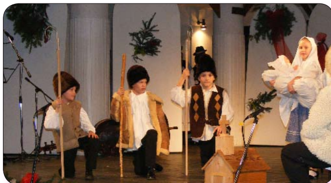
A Jászapáti Város Kultúrájáért Közhasznú Egyesület ünnepi műsorában a Városi Vegyeskar, a Színjátzó Kör, A Hétszínvirág Táncegyüttes csoportjainak előadása szerepelt.