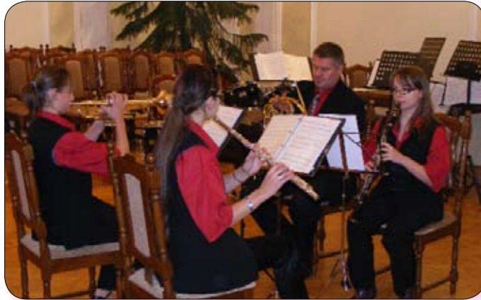
A Rácz Aladár Zeneiskola karácsonyi hangversenyt rendezett a gimnázium aulájában.