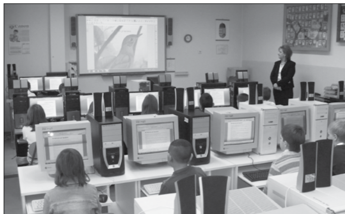
Bemutató tanítás az általános iskolában, ahol mostantól digitális táblák és a modern technika segítik a diákok tanulását és tanítását.

A projekt végrehajtására az iskola és Jászapáti Város Önkormányzata projektmenedzsmentet hozott létre, ami az eszközök felszereléséért, valamint az új módszerekkel való oktatás fenntarthatóságáért felelős. Az E-táblák beüzemelése várhatóan még az idén befejeződik, ugyanúgy a pedagógusok felkészítése az új készülékek használatára. A tanév során a nevelők bemutató órákat is tartanak az új technikák alkalmazásával. Reményeink szerint a digitális táblák a tudás megszerzésének új, hatékony eszközévé válnak a jászapáti iskoláskorú gyermekek nevelésének folyamatában, és az oktatást még színvonalasabbá teszik a Jászapáti Általános és Alapfokú Művészeti Iskolában.