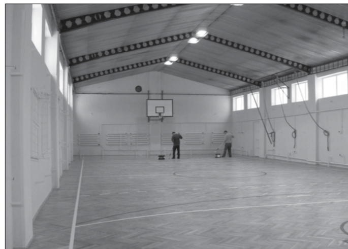
Jól halad a Damjanich úti tornaterem felújítása, jelenleg a padló lakkozása zajlik.