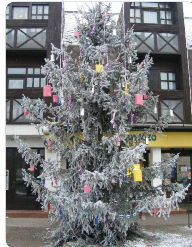
Vállalkozók fenyőfája 2010. Cikk a 9. oldalon