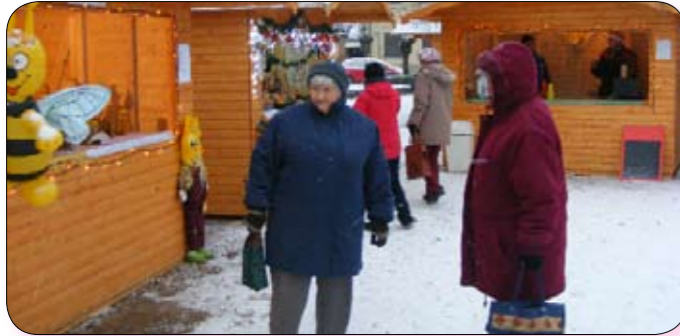
Ádventi vásár a főtéren.