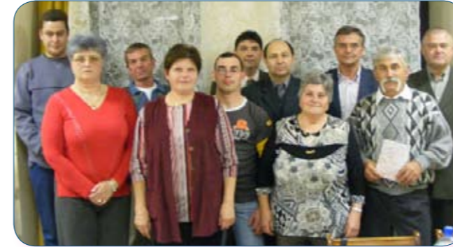
A Jászapáti 2000 Mg. Zrt. kitüntetett Véraladói.