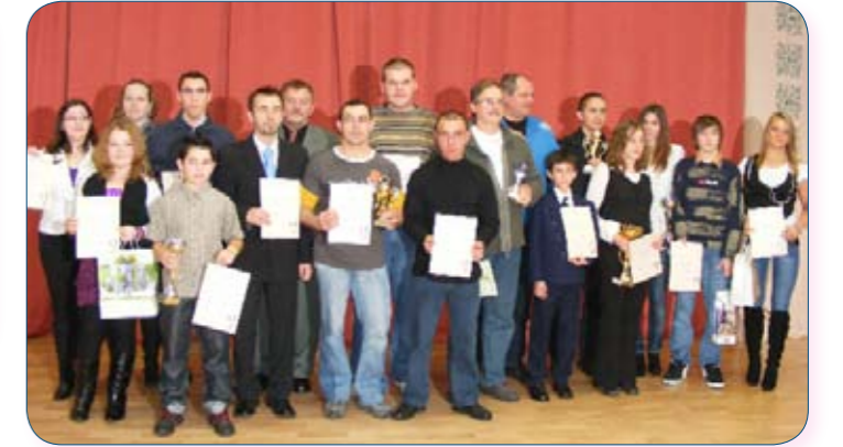
Az Év Sportolói 2010-ben. Cikkünk a 11. oldalon.