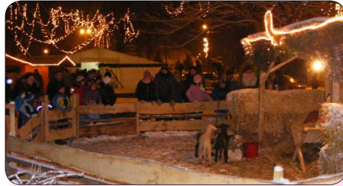
Élő állatok, forralt bor, vásár, rendezvények, zene és ádventi fények varázsoltak ünnepi hangulatot karácsony előtt a városban.