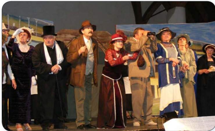
Megérdemelt vastaps a helyi színjátszóknak a My Fair Lady című darab bemutatóján. (cikk a 4. oldalon)