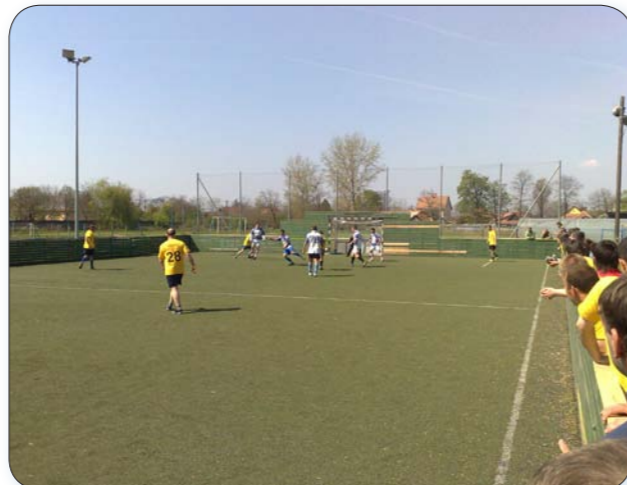
Elindult a Jászapáti kispályás labdarúgó bajnokság tavaszi szezonja (cikk a 11. oldalon)