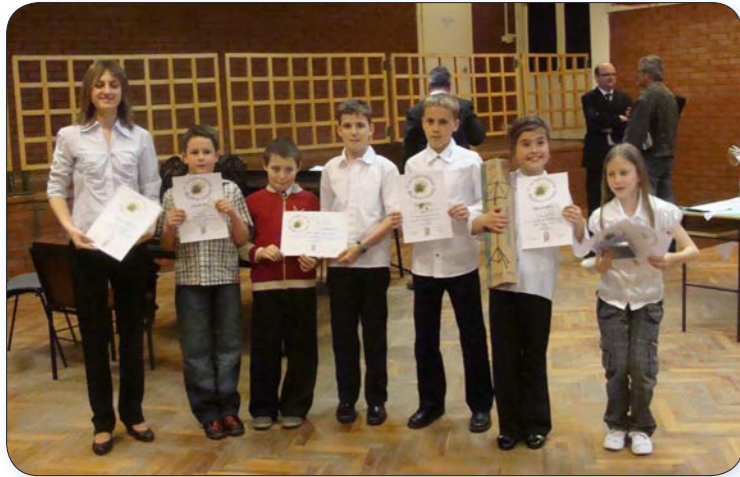
A fiatal tehetségek tanáruk körében. (cikk a 3. oldalon)