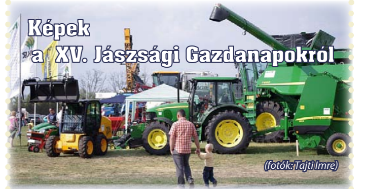
Képek a XV. Jászsági Gazdanapokról

A Jászapátiak Baráti Egyesületének hagyományos kerékpártúrája a rendezvényre július 2-án reggel 9 órakor indul a Polgármesteri hivatal előtti parkolóból. Minden kerékpározót várunk!