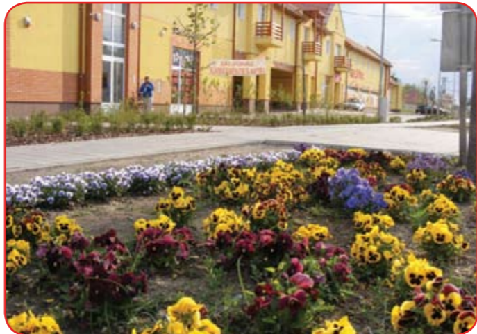
Április közepén elkészült a CBA előtti terület parkosítása