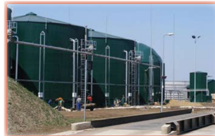
Az élő rész, a biogáz készítése a három nagy tartályban zajlik. Kívül a munkások a tereprendezést és a térburkolatokat készítik