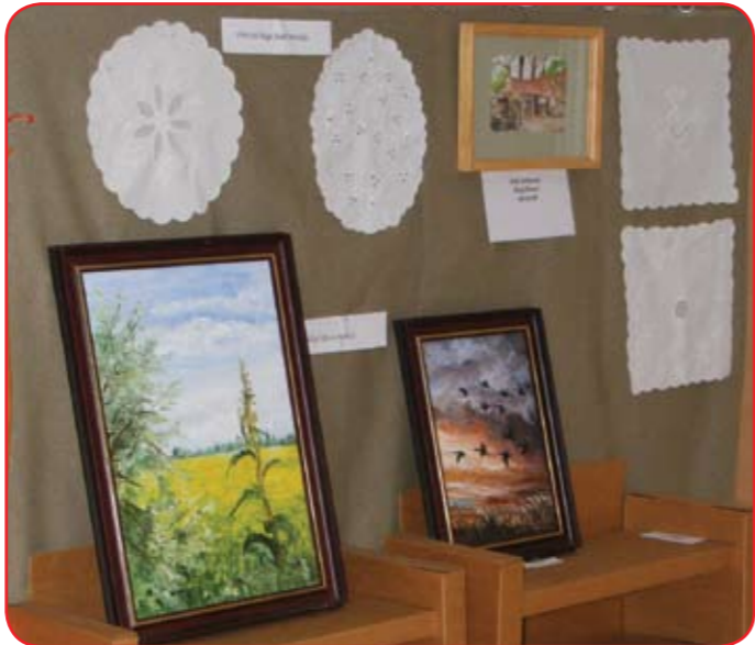
A Föld Napjára kiállítással is készült az idén 10 éves Zöld Pont Környezetvédelmi Egyesület (Cikkünk a 3. oldalon olvasható.)