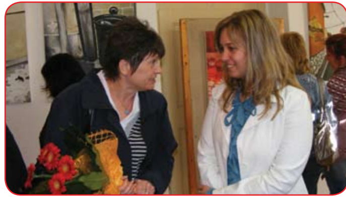
Pongó Gabriella első kiállítását egykori rajztanára nyitotta meg. (Írásunk az 5. oldalon.)