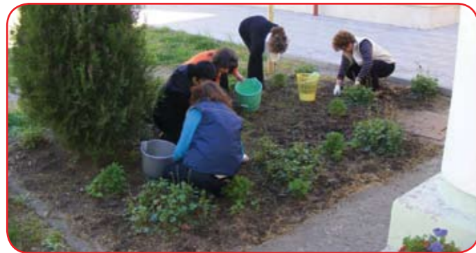
A Föld Napja alkalmából a város több pontján megszépültek a közterek. Képzünkön a könyvtár dolgozói kertészkednek a belső udvarban.