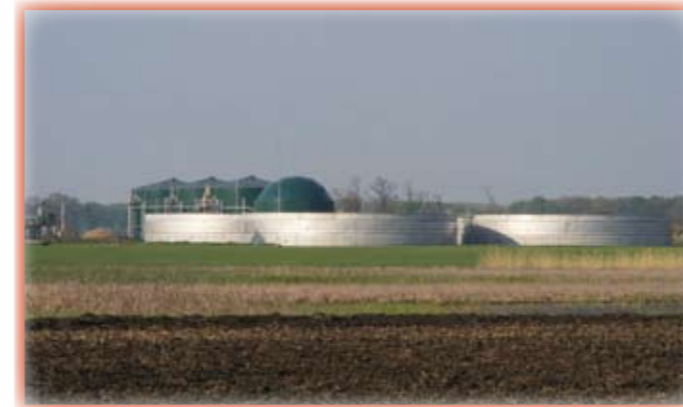
Megkezdte próbaüzemelését a Jászapáti 2000 Mg. Zrt. Biogáz Üzeme. Látkép a 31-es út felől, előtérben a pihentető tározókkal