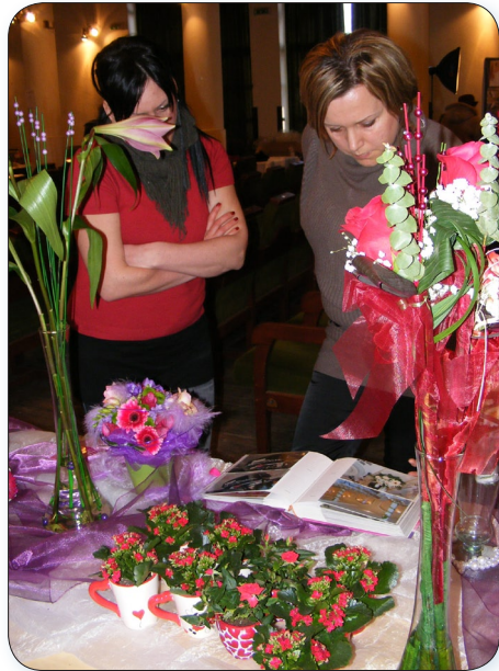
A menyasszonyok az idén is szépek lesznek. Az Evelyn Ruhaszalon Esküvői kiállításán az érdeklődők biztosan találtak a családi rendezvényükhöz való kínálatot.