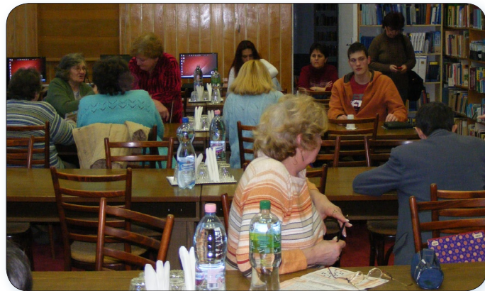
Megkezdődött a rejtvényfejtő szezon. Képünk az idei első verseny előtt készült a könyvtárban.