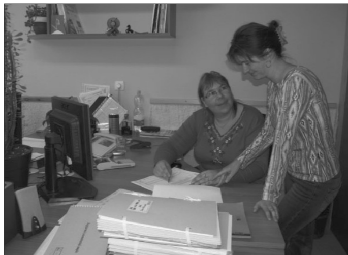
A Jász-Consulting Kft. irodája

A számviteli szolgáltatásokon kívül az európai követelményeknek megfelelő pályázatok készítésével segítjük elő a vállalkozások, non-profit szervezetek, magán-személyek, vállalkozók Európai Unió integrációját, amit a felhalmozott szaktudás, és Európai Unió pályázatok ismerete tesz lehetővé.