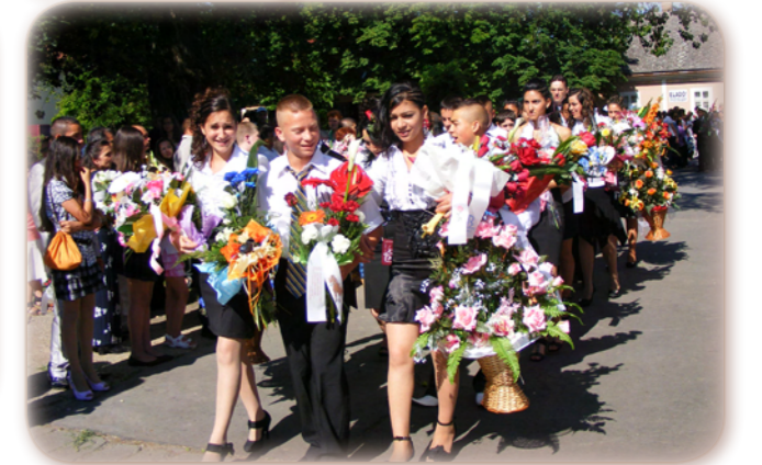
Ballagó általános iskolások