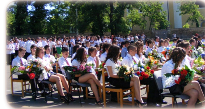
Búcsú sz iskolától. (Cikk a 9. oldalon.)