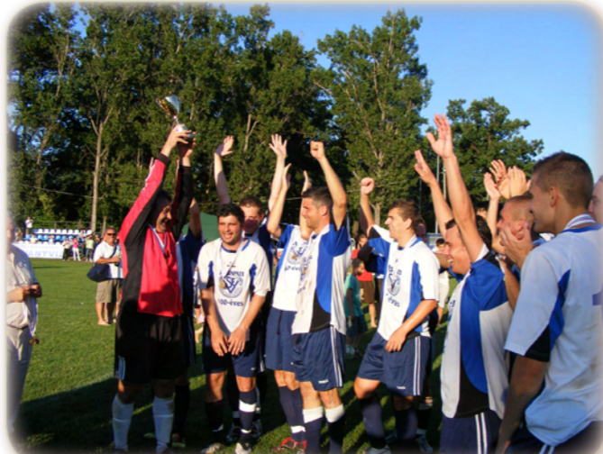
A Jászapáti labdarúgó csapata megnyerte a megyei I. osztályú bajnokságot.