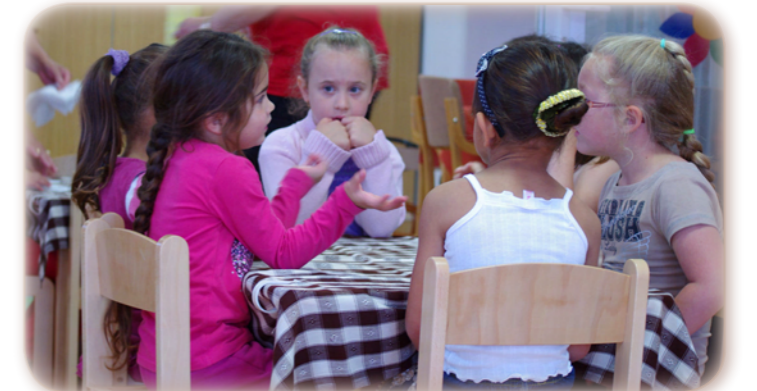
Júniustól használhatják a kicsik a felújított Margaréta óvodát.

A József Attila úti „Margaréta Óvoda” épületének felújítása, a Minden gyermek Óvodája projekt II. ütemeként valósult meg, amelynek tartalma: a meglévő lapos tető átalakítása magastetővé. Az épület külső homlokzati vakolatának javítása, festése, nyílászárók cseréje, új csapadékvíz-elvezető csatorna kiépítése. Az épület villámvédelmének kialakítása, belső falak felületkezelése, elektromos rendszer felülvizsgálata, javítása, szerelvények cseréje. Komplex óvodai nevelési programok megvalósításához a meglévő épület bővítése tornaszobával, szertárral, új korszerű belső berendezési és oktatási eszközök beszerzése.