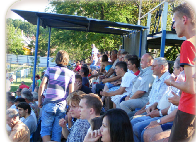
A csapat szurkolói a szezon utolsó mérkőzésén.