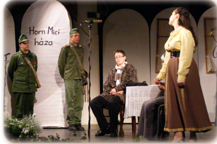
Jelenet a darabból.