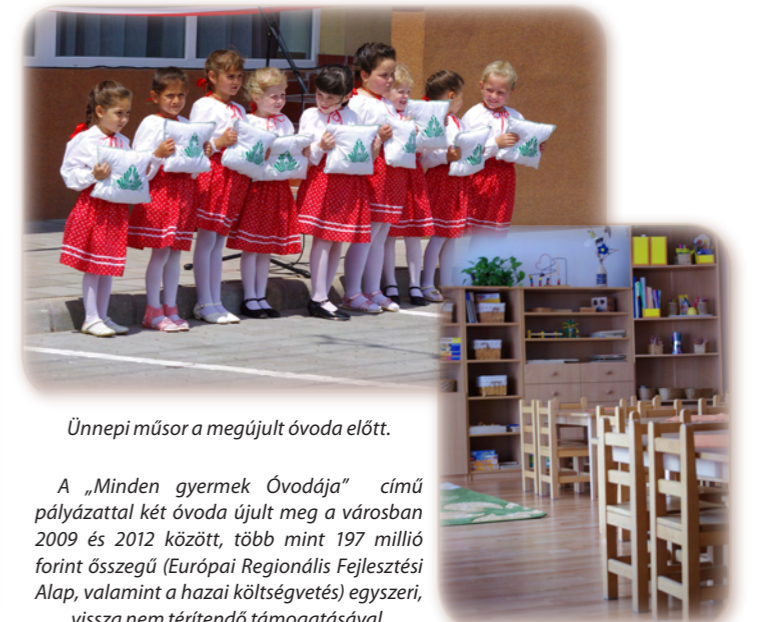
Ünnepi műsor a megújult óvoda előtt.

A „Minden gyermek Óvodája” című pályázattal két óvoda újult meg a városban 2009 és 2012 között, több mint 197 millió forint összegű (Európai Regionális Fejlesztési Alap, valamint a hazai költségvetés) egyszeri, vissza nem térítendő támogatásával.