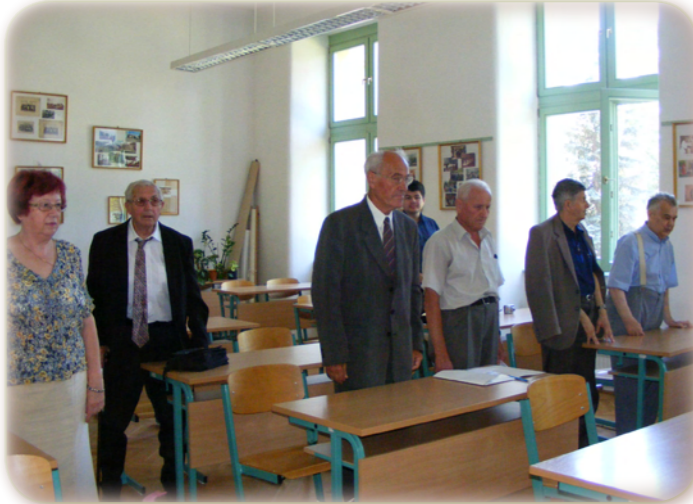
65 éves érettségi találkozó. (Újra az iskolában című írásunk a 9. oldalon.)