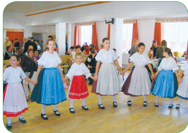
Tölkjő csárda és táncház a Szeredás együttesel