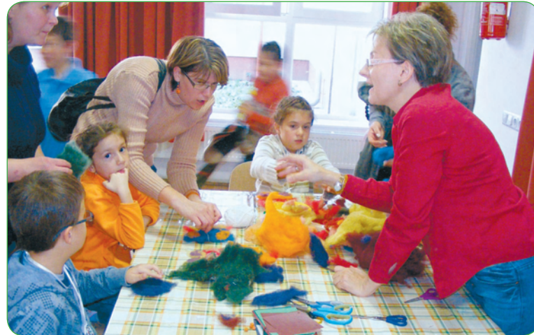
Kézműves játszóház a Művészetek házában