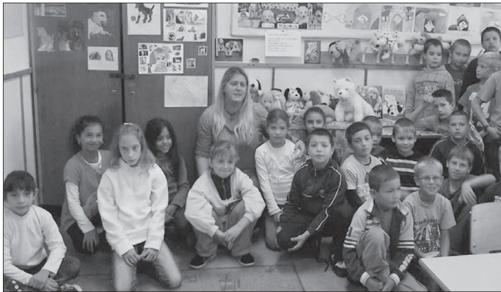
Egy hét az iskolában az állatokról szólt.

A hét programjaival többek között a következő célokat sikerült elérnünk: