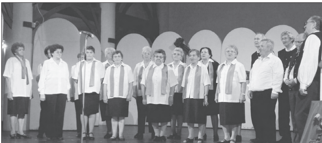
A Városi Vegyeskar és a Muskátli Népdalkör közös hangversenyyel emlékezett Jászapáti nagy fiára a művelődési házban

Ma már mindenki tudja, de azért nem árt hangsúlyozni, hogy Vágó Pál művészi hagyatéka nemzeti kincsünk . Hogyne lenne akkor az kincs nekünk, jászapátiaknak! Óriási érték az a néhány kép is, ami itt