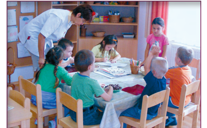
Öt csoportban 131 kisgyerekre vigyáznak az óvónénik és daduskák.