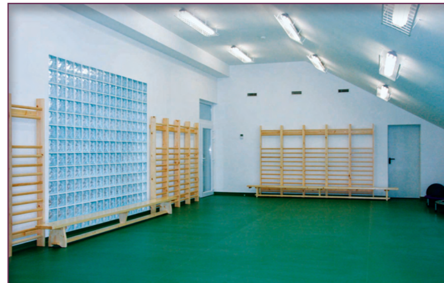
A kicsik rengeteg mozgást igényelnek, ezért épült a tetőtérben tornaszoba is.