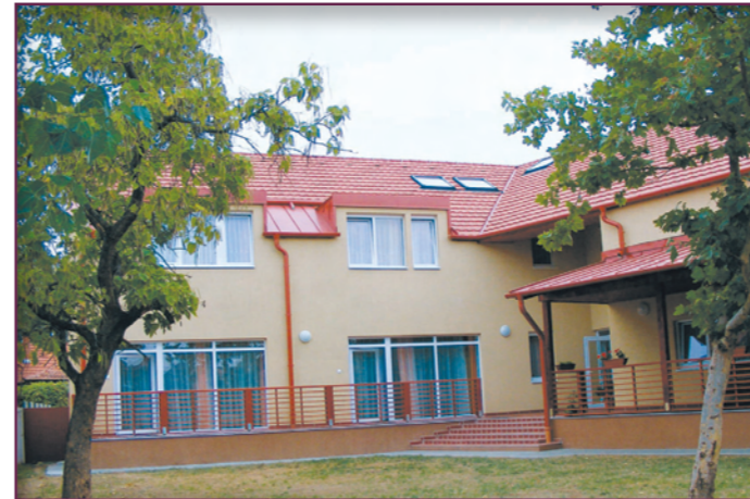
Szeptembertől a megújult Margaréta óvoda is várta a kicsiket, akik nagy örömmel vették birtokba a szép csoportszobákat, új bútorokat, játékokat. Rossz időben a hatalmas fedett teraszt is használhatják.