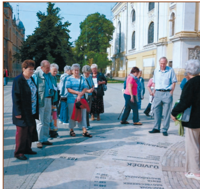
A könyvtár nyugdíjas klubja Kecskeméten járt. (A kirándulásról szóló cikkünk a 9. oldalon.)

A beruházás része a „Jászberényi és Dél-Hevesi kistérségben lévő felhagyott hulladéklerakók rekultivációja” című projektnek, ami az Európai Unió támogatásával, a Kohéziós Alap társfinanszírozásával valósul meg. Kedvezményezett a REGIO-KOM Térségi Kommunális Szolgáltató Társulás.