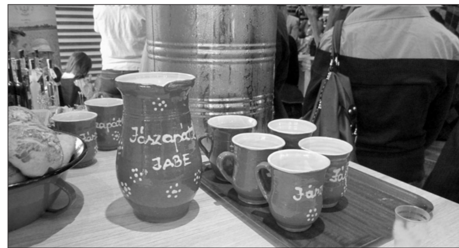
Jászapáti termékek is bemutatkoznak és kaphatók az új üzletben.