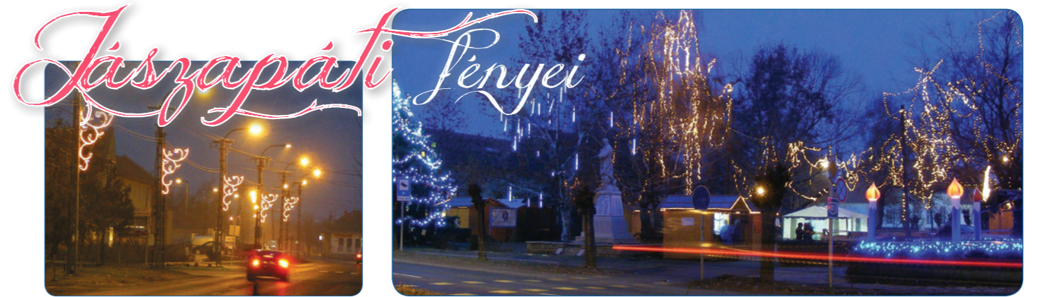
Ádventi fények a városban

JÁSZAPÁTI ÉS KÖRNYÉKE FÜGGETLEN HAVILAPJA * XXIV. ÉVFOLYAM * 1. SZÁM * 2013. JANUÁR HÓ