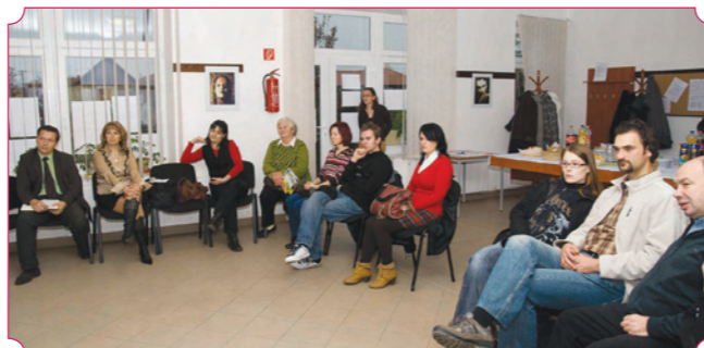
A Jászapáti Baráti Egyesülete az MNVH projekt keretében rendezte meg Jászapátián a Civilek és vállalkozások közös útja a vidékfejlesztésben című konferenciát és Jánoshidán az IKSZT információs napot. (Teljes cikk az 5. oldalon)