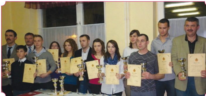
Az Év Sportolói. Az önkormányzat Szociális, Sport, Nemzetiségügyi Bizottsága, ünnepségen köszöntötte a város legeredményesebb sportolói. (cikkünk a 11. oldalon)