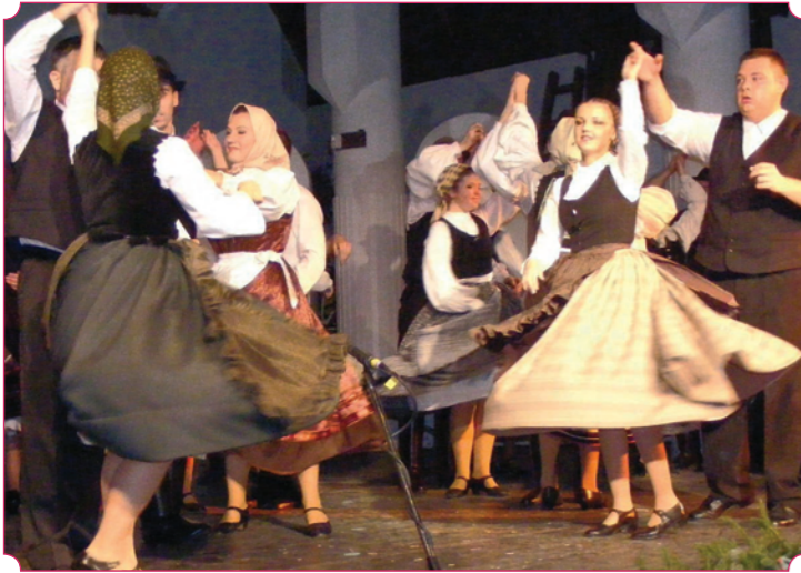
A Jásztánc Alapítvány hagyományos karácsonyi műsorában új előadást is láthatott a közönség. A „Bonchidai nagy hegy alatt” címmel, magyar-román-és cigánytáncok együtt jelentek meg a mai, európai közösség szellemében.