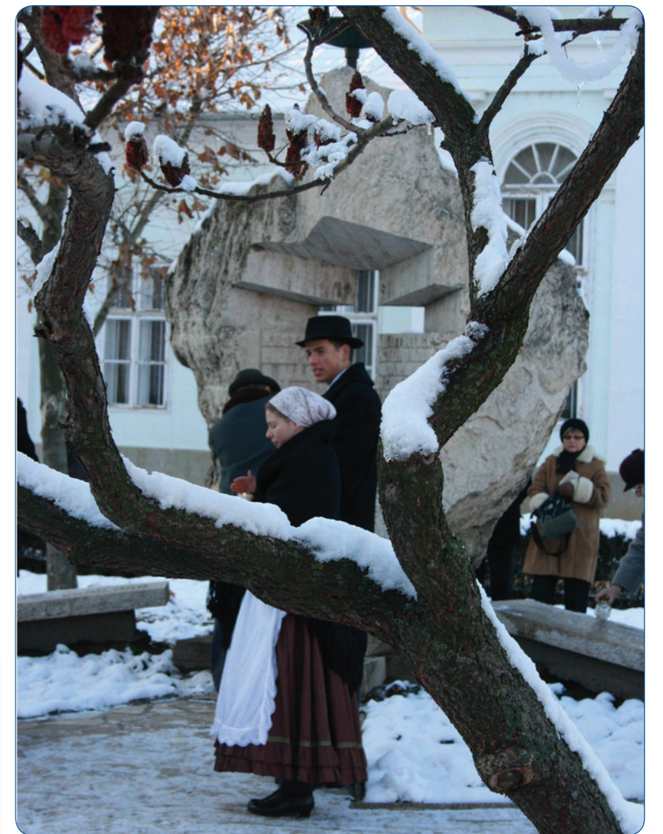
Koszorúzás a második világháborús emlékműnél. A JABE legújabb könyvének bemutatója előtt. (Vallomások című cikkünk a 6. oldalon.)