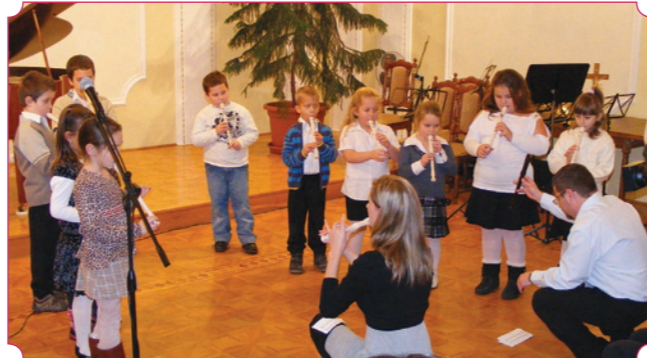
A közismert angol dal is megszólalt a kicsik furulyáján a Rácz Aladár Zeneiskolások karácsonyi koncertjén a gimnázium dísztermében.