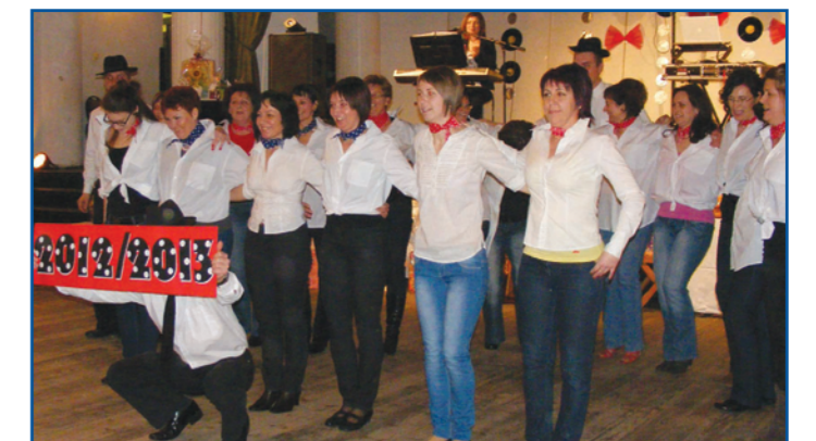
Az általános iskola tanári csapata a bál műsorában.