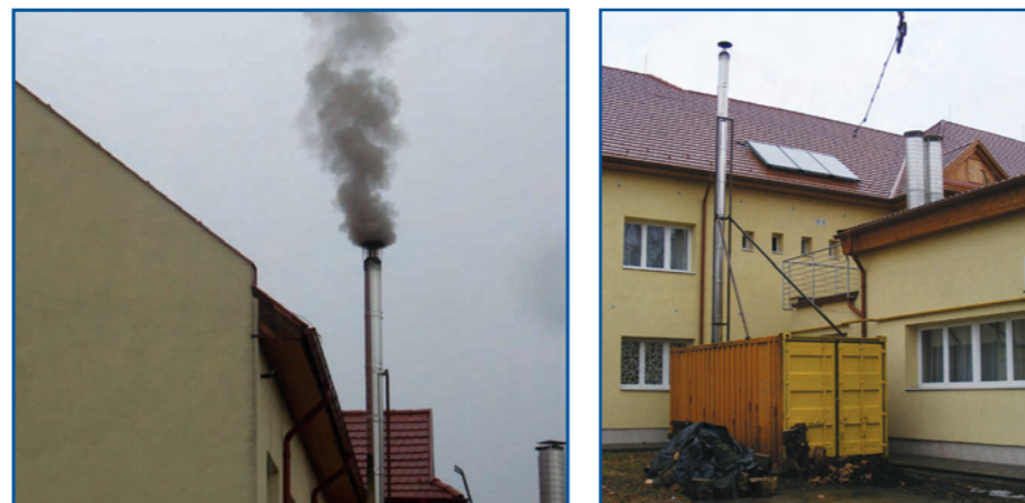
A fenntarthatóság jegyében.