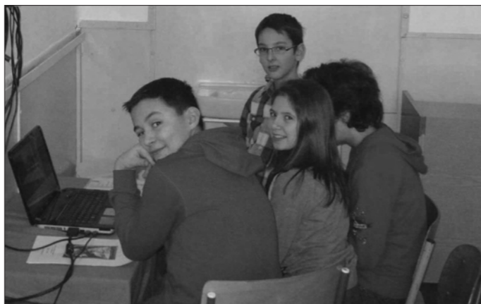
Beszélgetés angolul Skype-on a külföldi diákokkal

- És Ön mit gondol, sokat tanultak ebből a gyerekek?