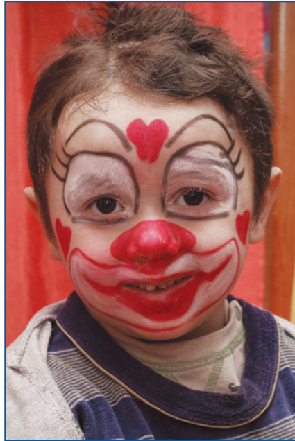
Farsangi arcfestés az óvodában