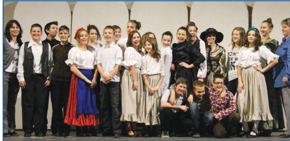
A Varázsdada című előadás szereplői. (Visszatekintő című írásunk a 9. oldalon)