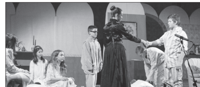
Jelenet a Varázsdada című előadásból