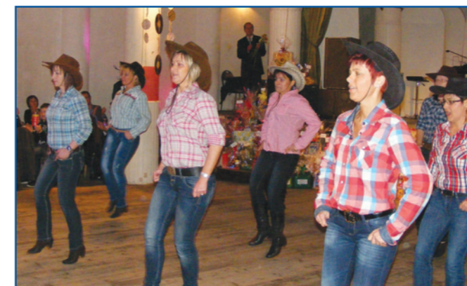
A szülők country-tánca a Retro bálban.