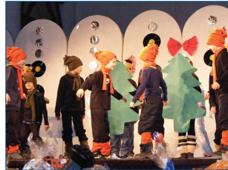
Az alapítványi bál műsorában a gyerekek téli játékokat elevenítettek meg a színpadon.