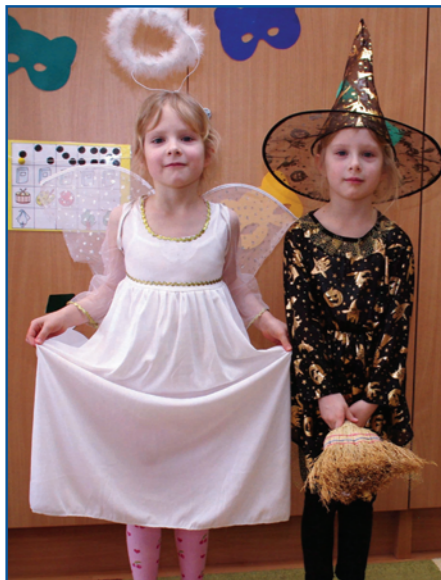
Tündér és boszorka.