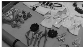
Az ajándéktárgyokat a gyerekek készítették a karácsonyi vásárra

- Nyelvtanulás szempontjából szerintem nagyon hasznos, úgy gondolom ezt a gyerekek is belátják, és rájöttek, hogy valamilyen idegen nyelvet tanulni kell,