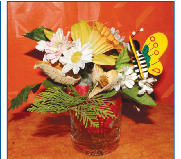
Hamarosan itt a tavasz, jön a húsvét! Kellemes húsvéti ünnepeket kívánunk Kedves Olvasóinknak! (A virágkötő: Zagyai Sándorné, a fotó: Fülöp Péter.)